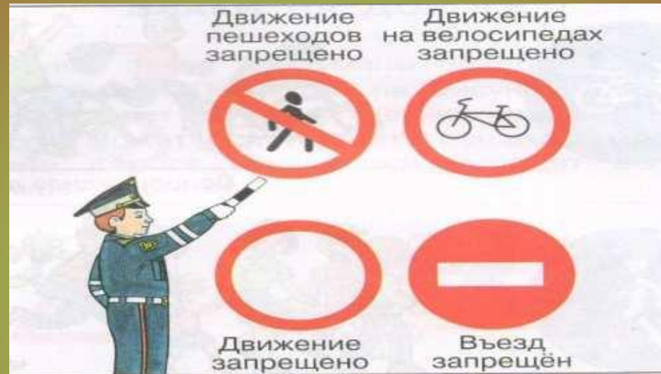
Рис. 6. Запрещающие знаки