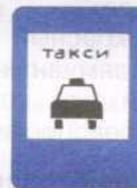
Место стоянки легковых такси