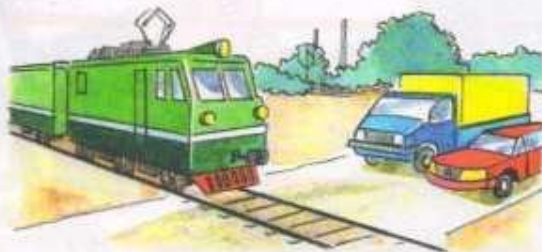
Железнодорожный переезд (без шлагбаума)