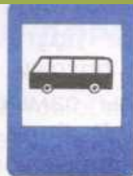
Место остановки автобуса