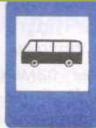
Место остановки автобуса