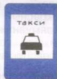
Место стоянки легковых такси