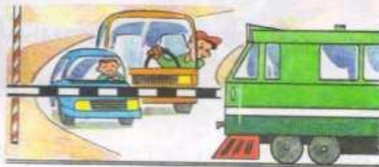
Железнодорожный переезд (со шлагбаумом)