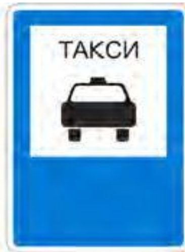
Место остановки легкового такси.