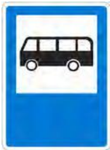
Место остановки автобуса и/или троллейбуса.