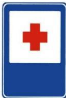
Пункт первой медицинской помощи