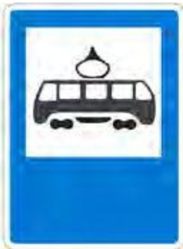
Место остановки трамвая.