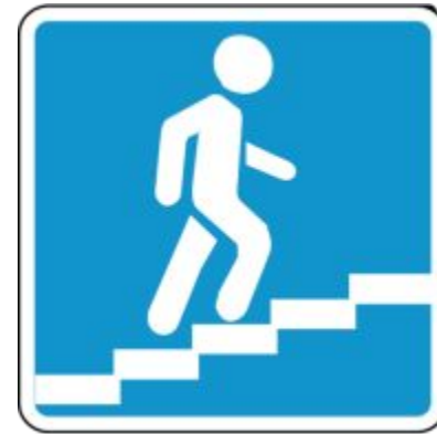
Надземный пешеходный переход.