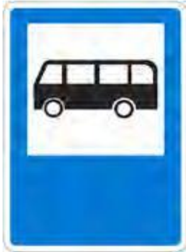
Место остановки автобуса и/или троллейбуса.