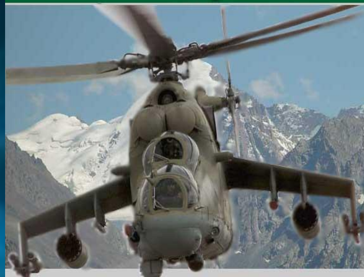
Авиация пограничных войск в Афганистане