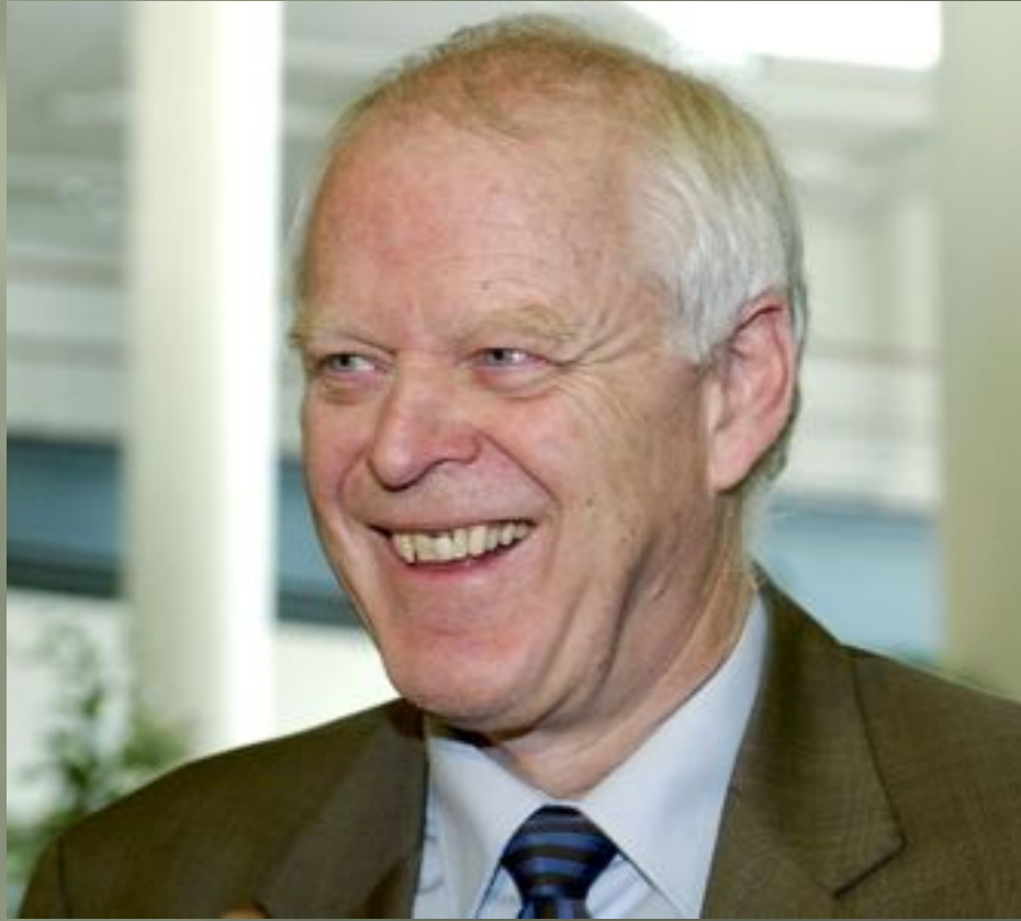
Комиссар по правам человека Совета Европы Томас Хаммарберг.