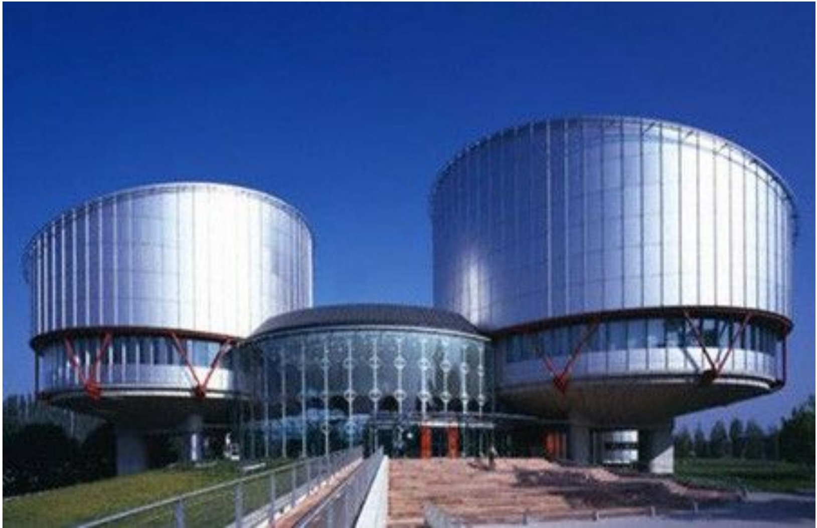
Здание Европейского суда по правам человека