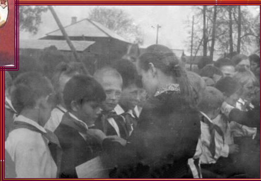
Торжественный прием в пионеры