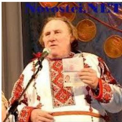
Я мордвин и горжусь этим