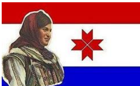
«Я чё, хуже русских?»