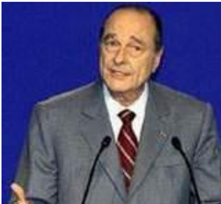
Жак Ширак, Президент Франции