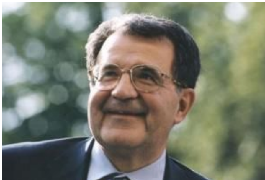
Романо Проди, Председатель Совета Министров Италии