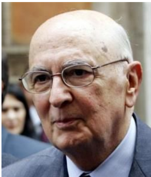
Джорджо Наполитано, Президент Италии