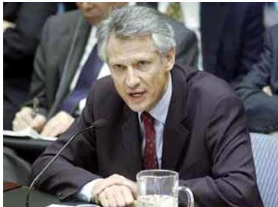
Доменик де Вильпен, Премьер - Министр Франции