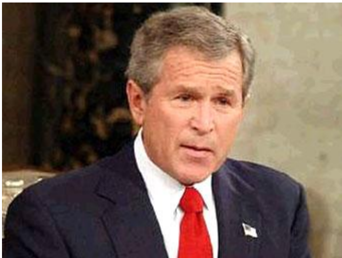
Джордж Буш, Президент Соединённых Штатов Америки