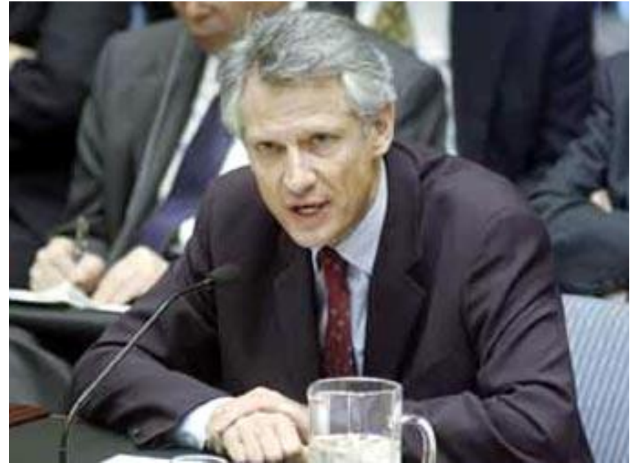
Доменик де Вильпен, Премьер - Министр Франции