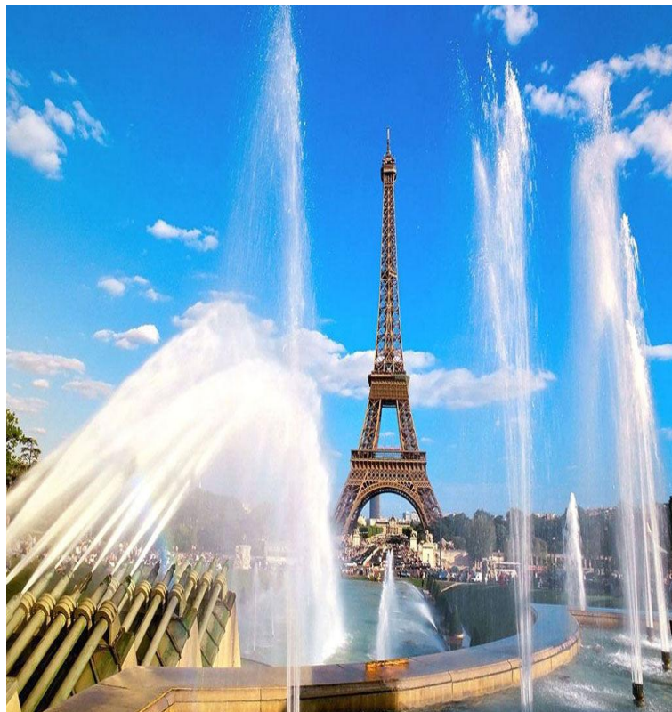
Париж- столица Франции. Эйфелева башня