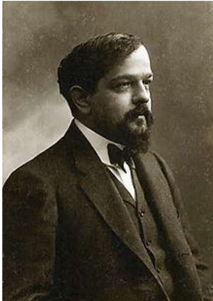
Клод ДЕБЮССИ 1862-1918