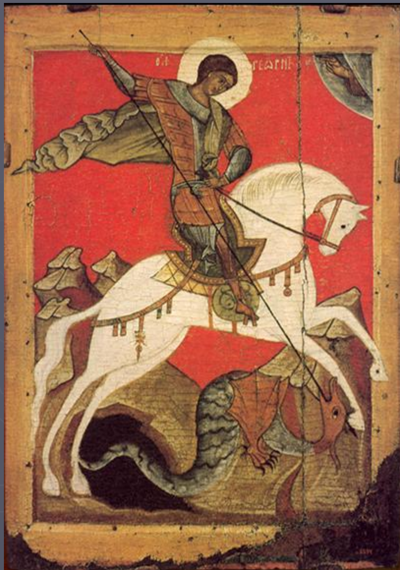
Чудо о змие. Святой Георгий. Русский музей.