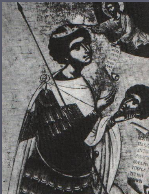
Св. Георгий- воин с отсеченной головой в руке. Греческая икона. Фрагмент. XV-XVI века