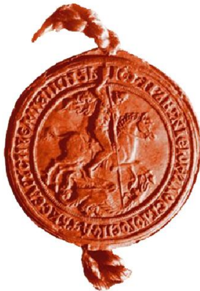
Печать Ивана III Васильевича 1497 г.