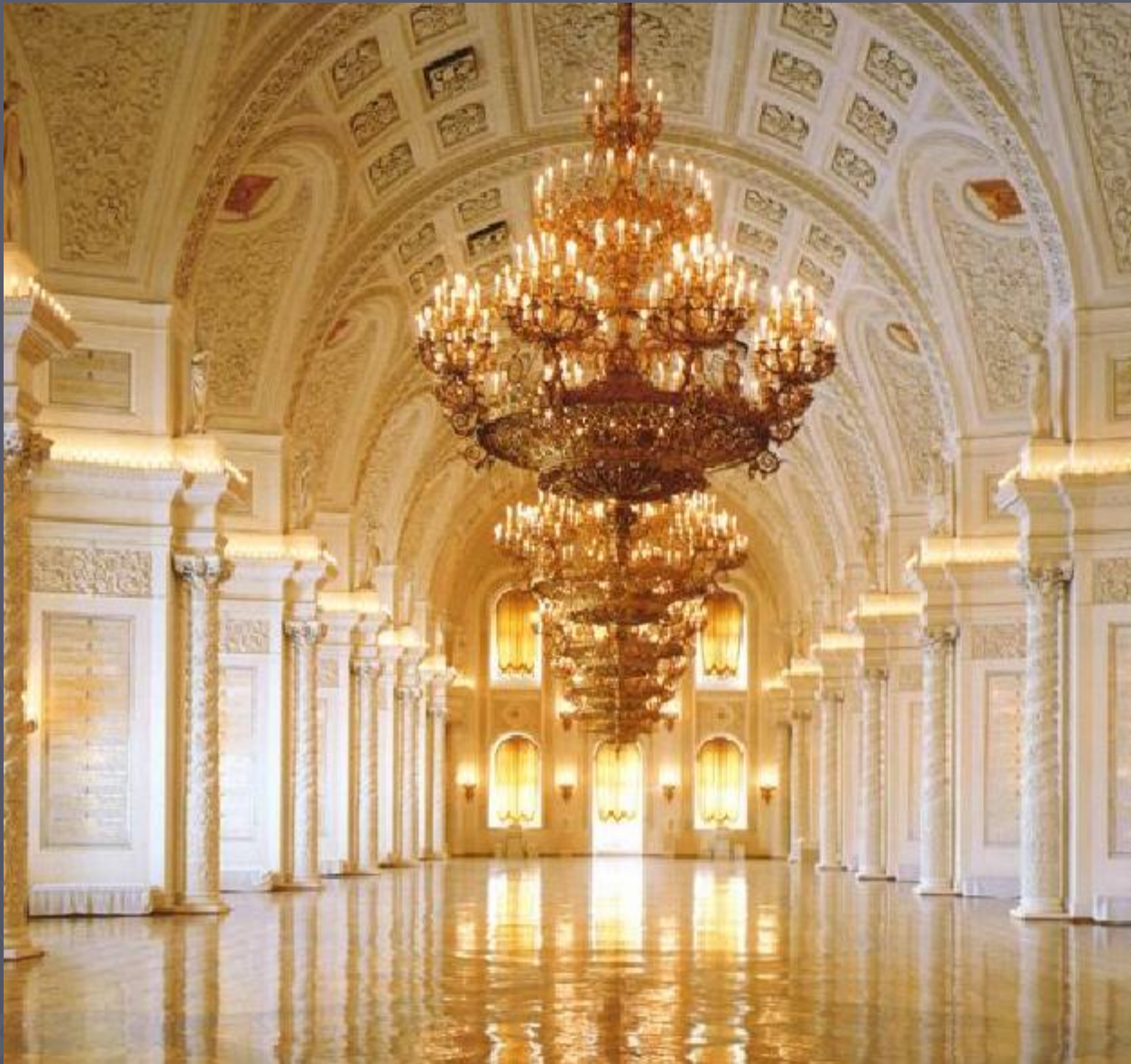
Георгиевский зал Кремля