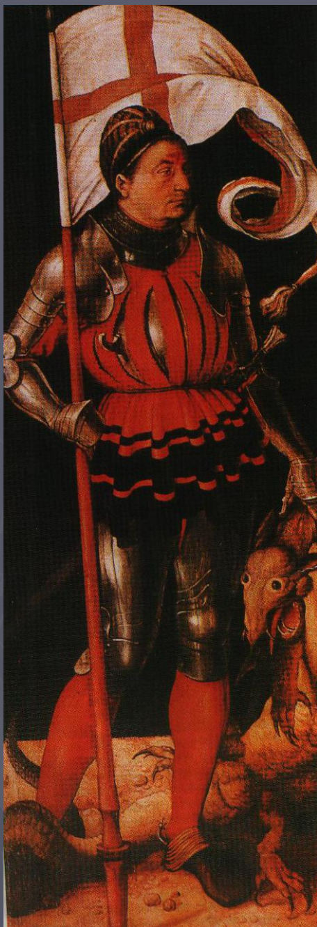
Альбрехт Дюрер. Святой Георгий (фрагмент Паумгартнеровского алтаря 1498-1503 годы)