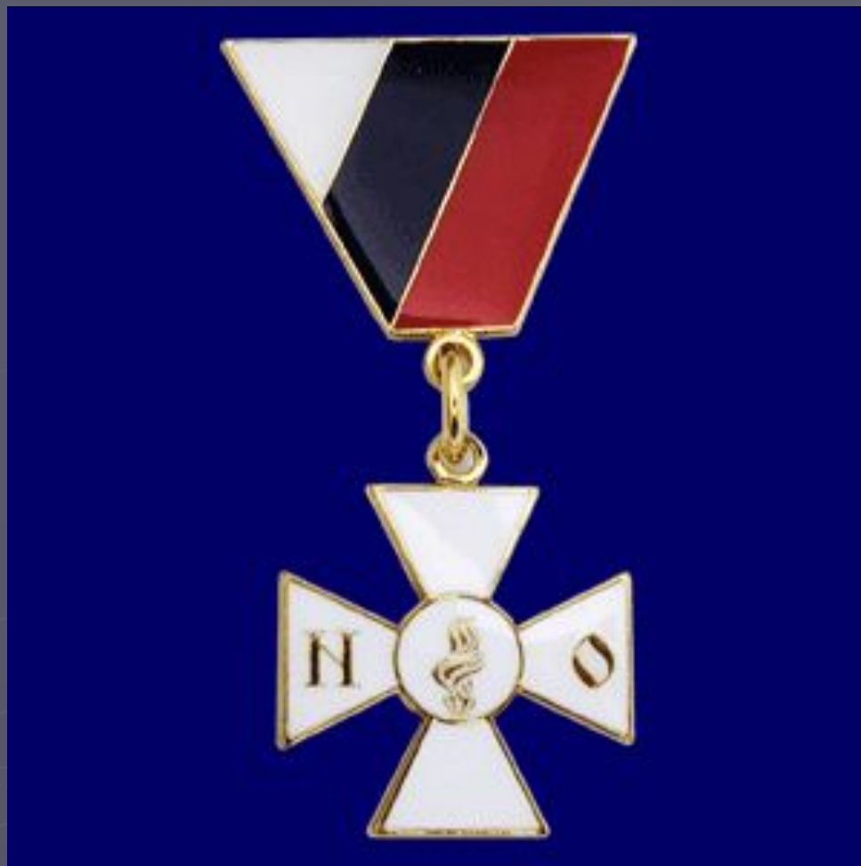
Современный Георгиевский крест