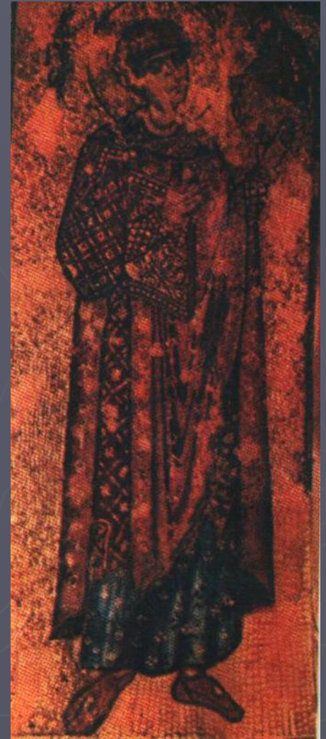
Мозаичная икона XIII век. Из монастыря Ксенофонта в Афоне.