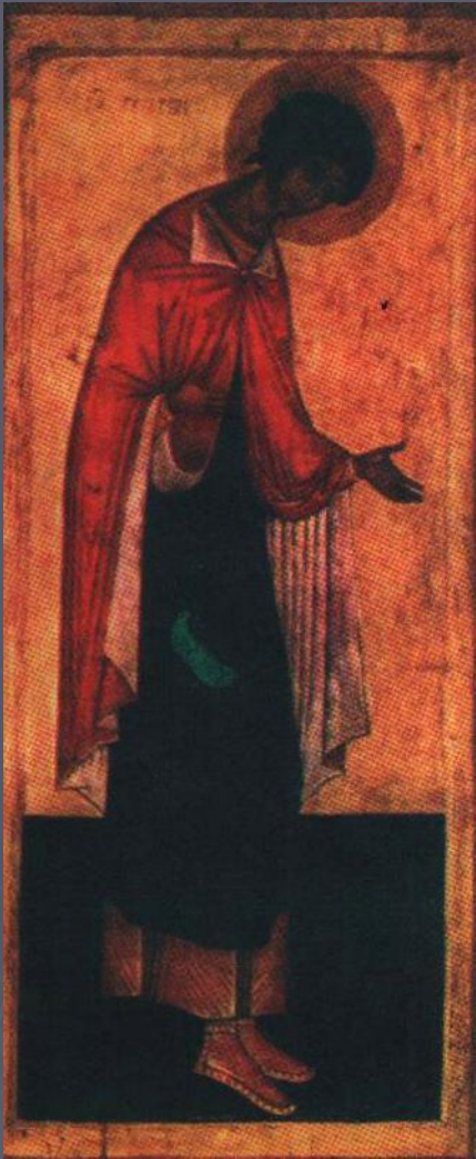
Русская икона. Около 1486 г. Село Бородава, Вологодская обл.