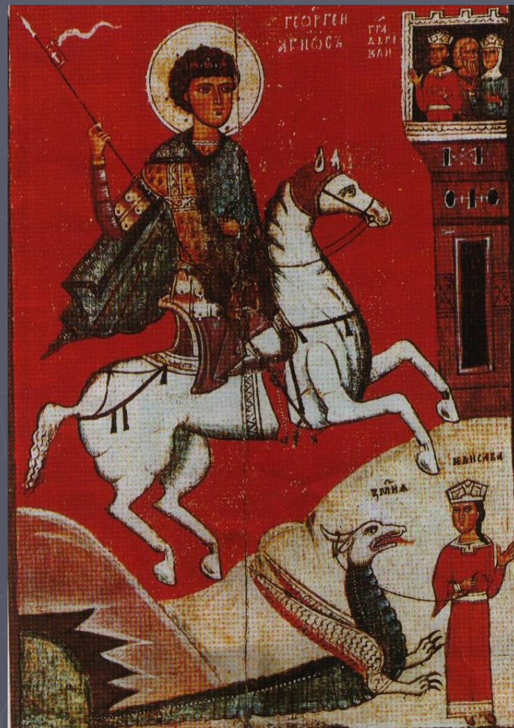
Св. Георгий. Чудо о змие. Новгородская икона XIV века.