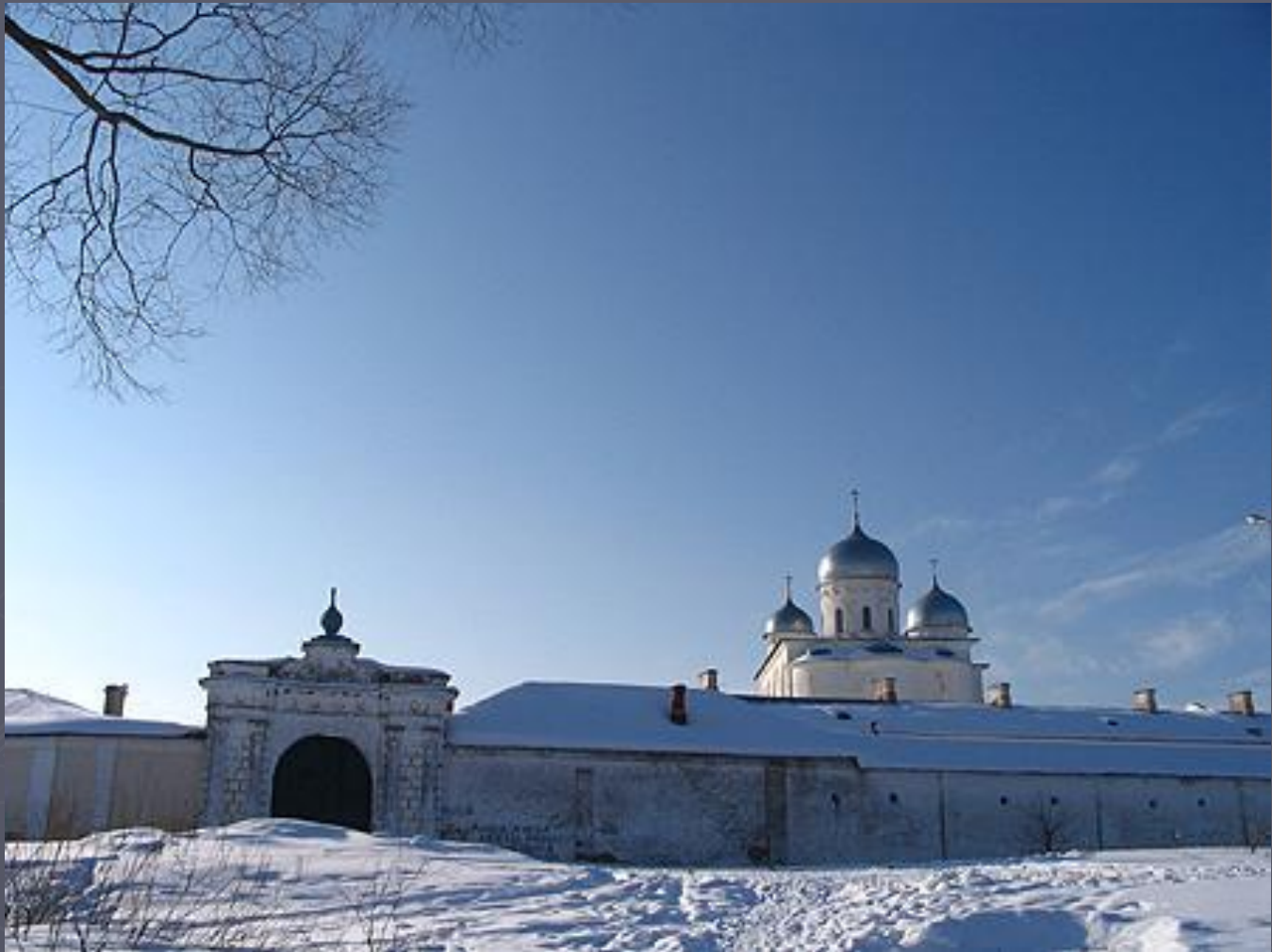
Юрьев монастырь в Новгороде