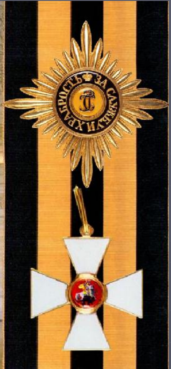
Георгиевский зал Кремля