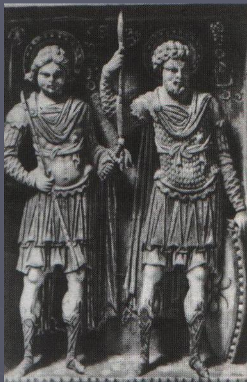
Св. Георгий-воин и Федор Тирон. Фрагмент византийского складня. X-XI век.