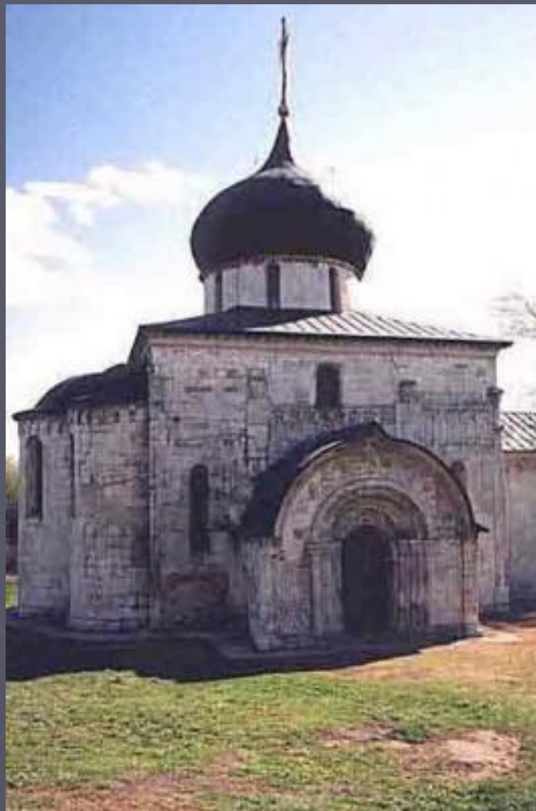
Георгиевский собор в Юрьеве-Польском