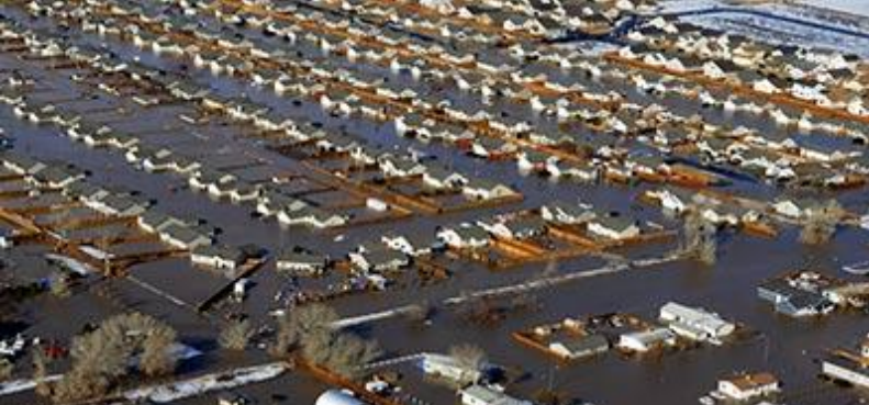
Прорыв дамбы в Штате Невада