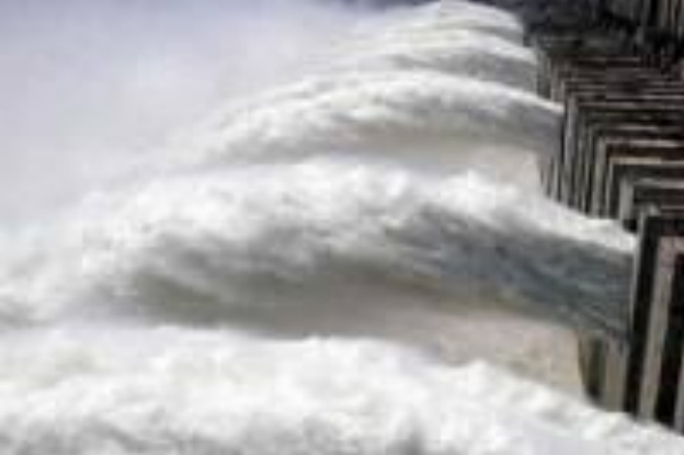
Прорыв плотины в Китае