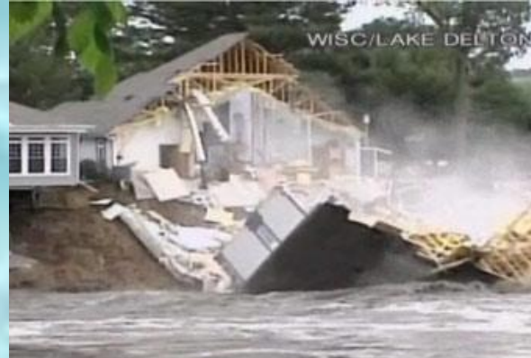
Прорыв плотины в Висконсине