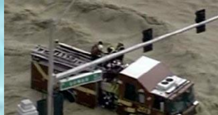
Прорыв дамбы в Штате Миссури