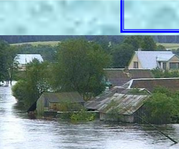
Прорыв плотины в Литве