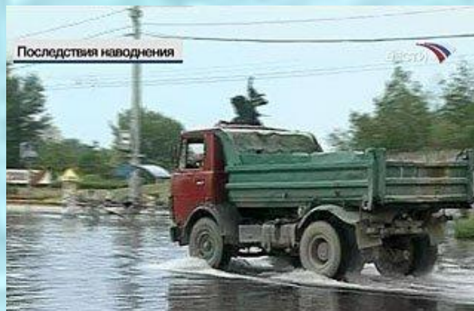
Прорыв дамбы в Тирасполе