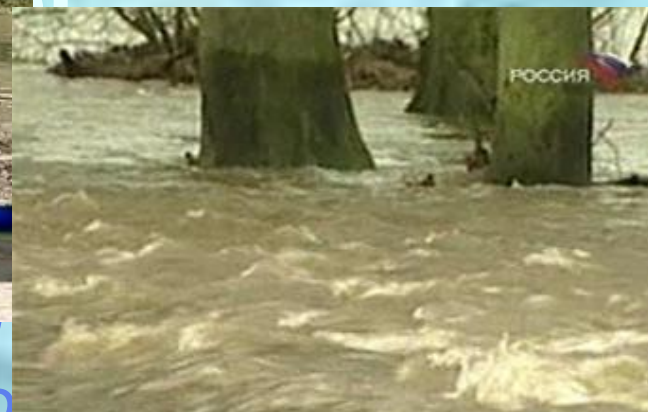
Прорыв плотины в Дагестане

...са образования т... ...авляемого пото... ...нилица из верх... ...устремляющегося через прорыв в... ...нижний бьеф.