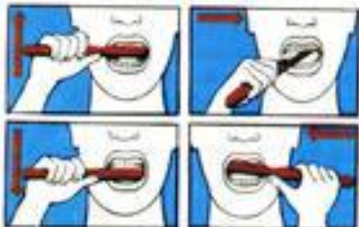
Как надо чистить зубы.