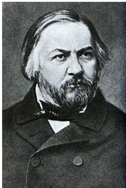
Михаил Иванович Глинка — русский композитор.

В 1990 году постановлением Верховного Совета РСФСР музыкальное произведение композитора Михаила Глинки «Патриотическая песня» было утверждено в качестве гимна РСФСР. 11 декабря 1993 года указом президента Бориса Ельцина музыка «Патриотической песни» Глинки была утверждена уже в качестве Государственного гимна РФ. Но сколько-нибудь удовлетворительный текст на эту музыку за семь лет существования данного гимна так и не был создан.