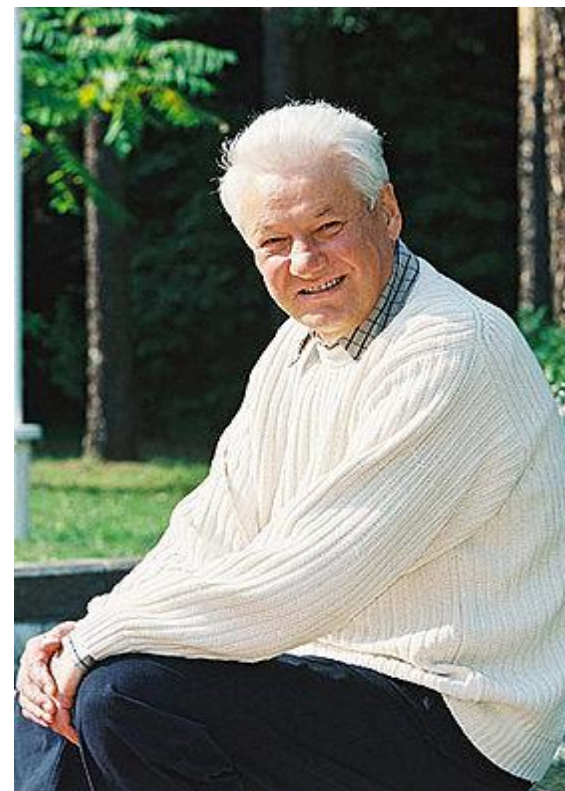
Борис Николаевич Ельцин — советский партийный и российский политический и государственный деятель, первый Президент Российской Федерации.