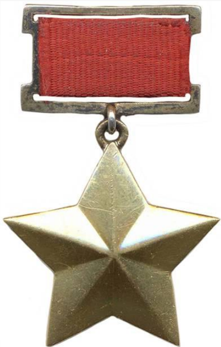
Медаль «Золотая Звезда»

Медаль учреждена 1 августа 1939 года Указом Президиума Верховного Совета СССР «О дополнительных знаках отличия для Героев Советского Союза» для граждан, удостоенных высшей степени отличия - звания «Герой Советского Союза».