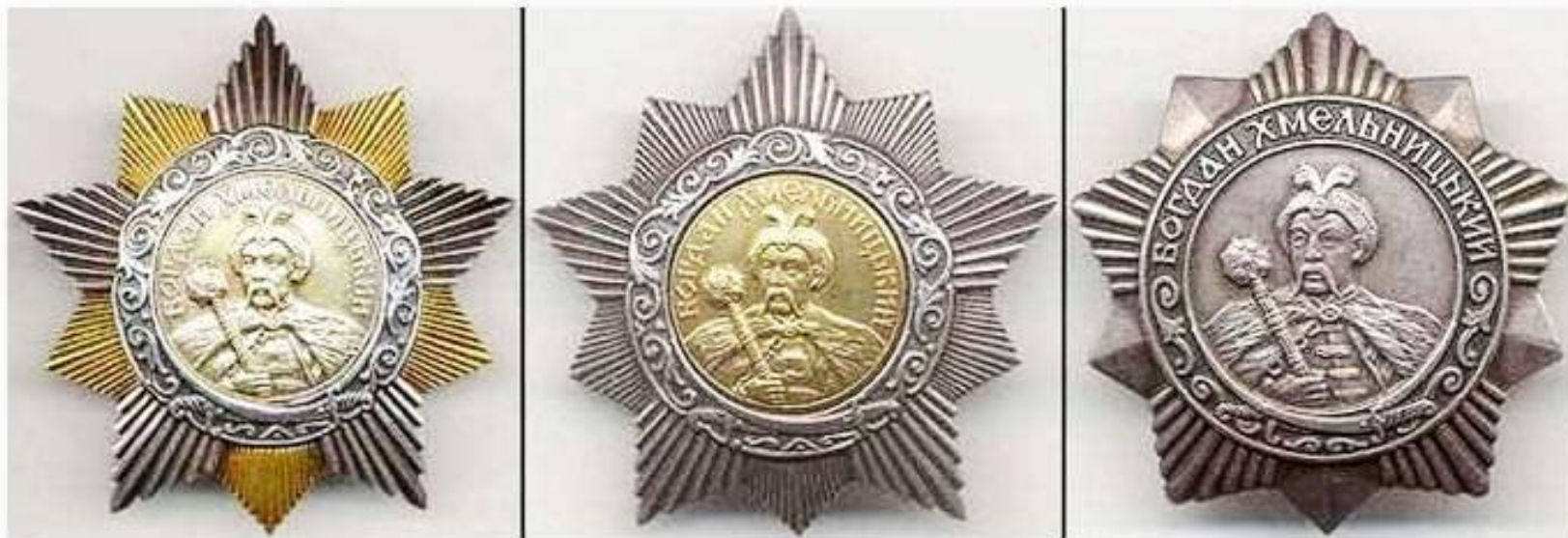
Орден Богдана Хмельницкого (1-2-3 степени)