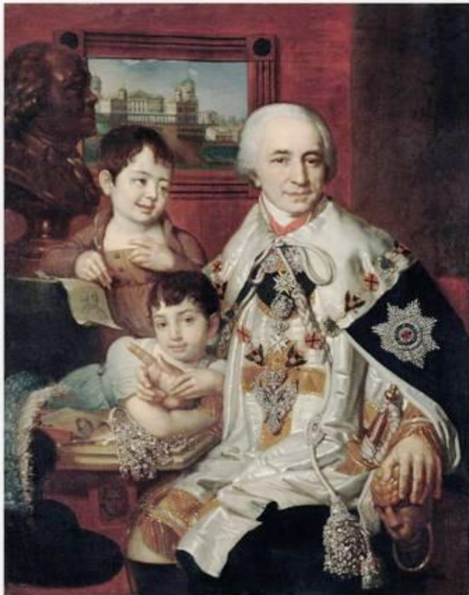
Портрет графа Г. Г. Кушелева в орденском одеянии и со знаком ордена Св. Андрея Первозванного с бриллиантами на орденской цепи.