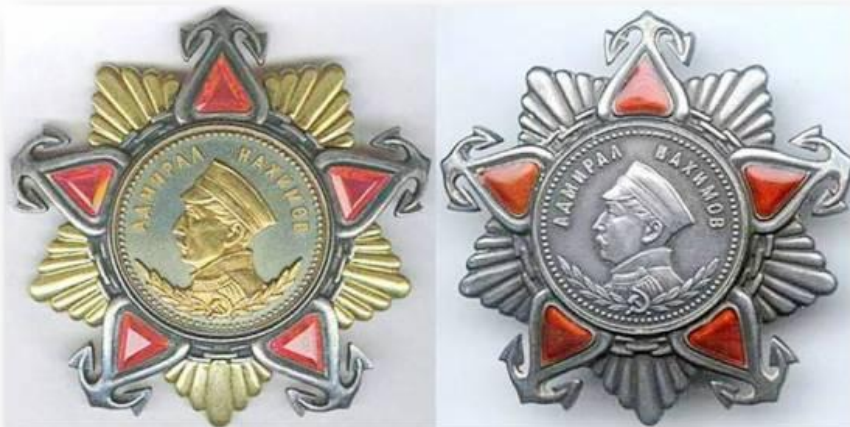
Орден Нахимова (1-2 степени)