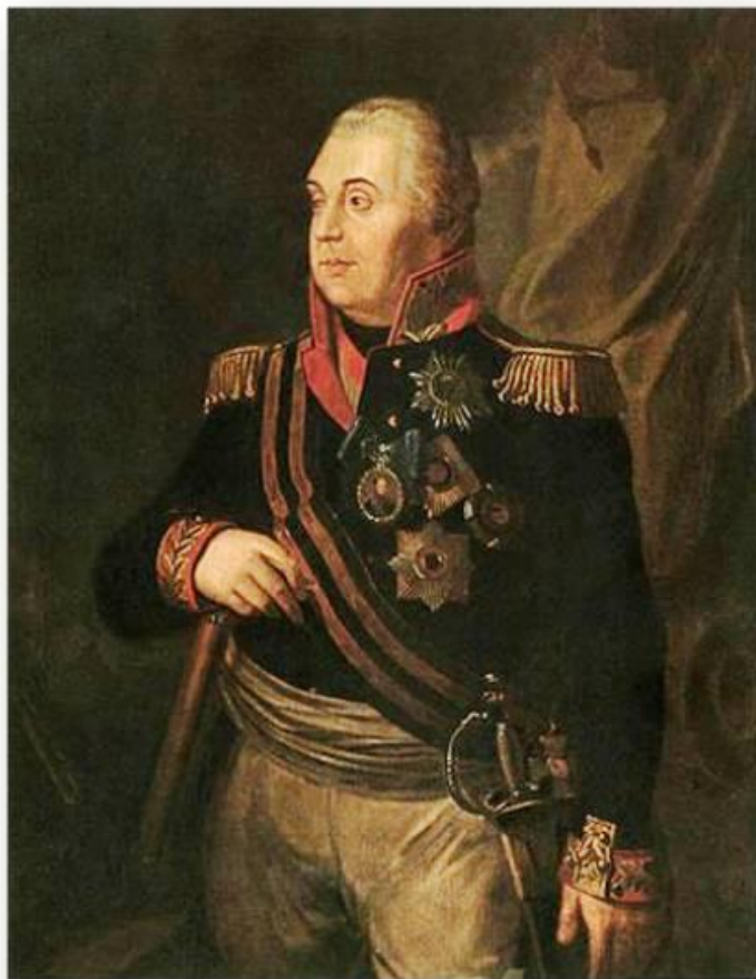
Генерал-фельдмаршал М. И. Кутузов, полный кавалер Ордена Святого Георгия. На портрете Знак ордена Святого Георгия 1-й степени (крест) на георгиевской ленте (за рукоятью шпаги) и его четырёхугольная звезда (2-я сверху).