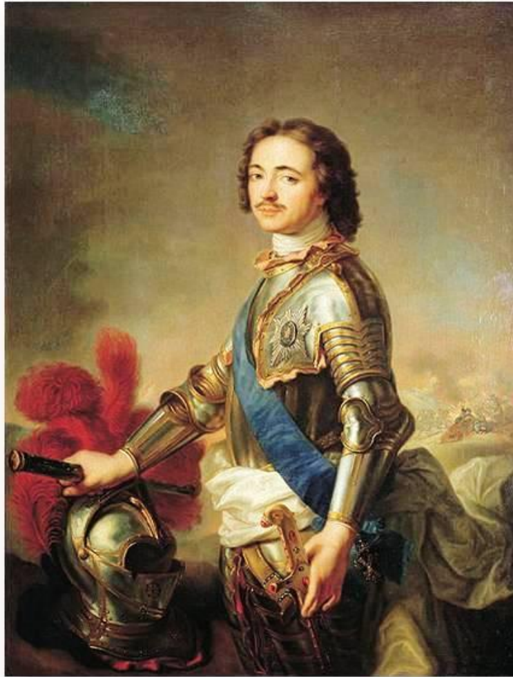
Петр I со знаком ордена Св. Андрея Первозванного на голубой андреевской ленте и звездой на груди.