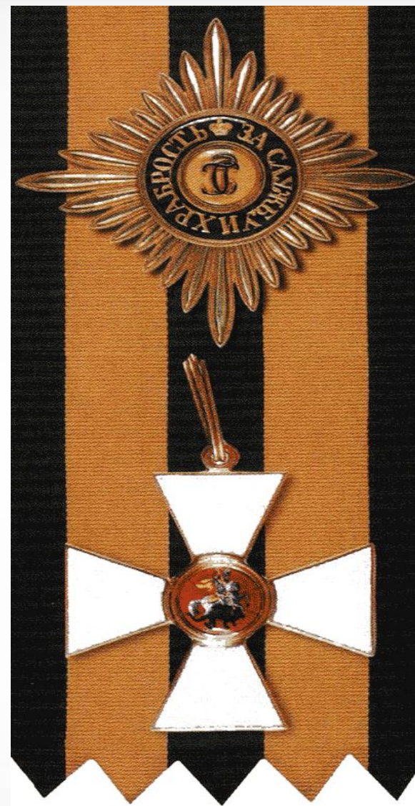
Орден и знак Святого Георгия