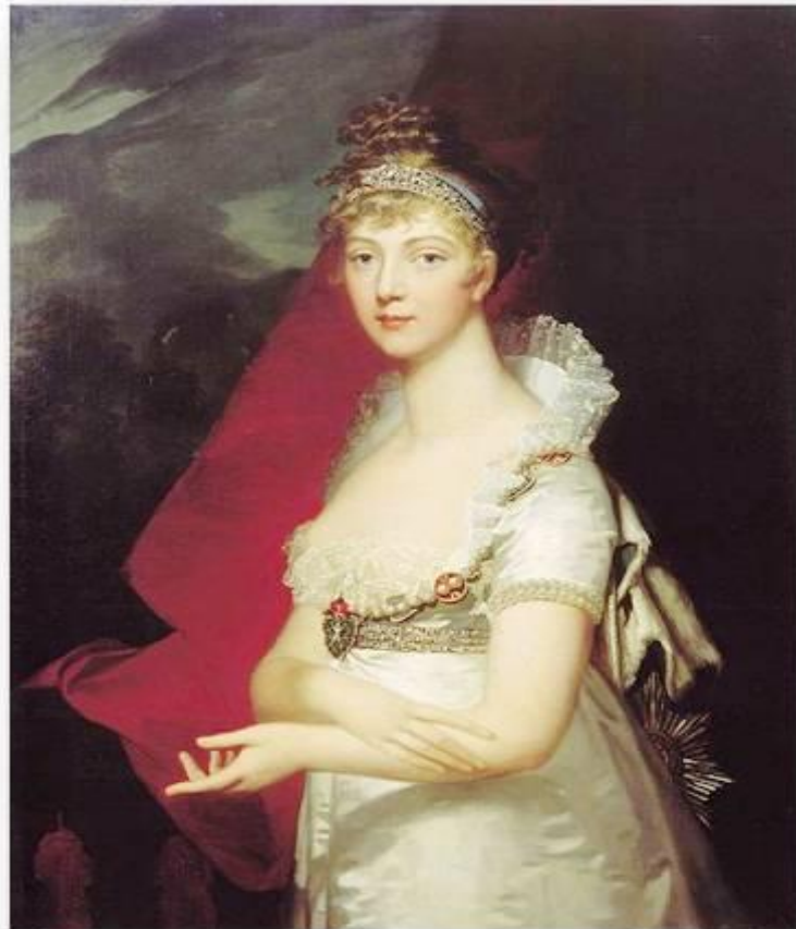
Портрет Елизаветы Алексеевны, жены Александра I, со знаком ордена Св. Андрея Первозванного на орденской цепи.