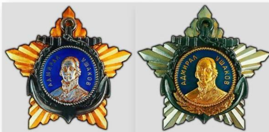
Орден Ушакова (1-2 степени)