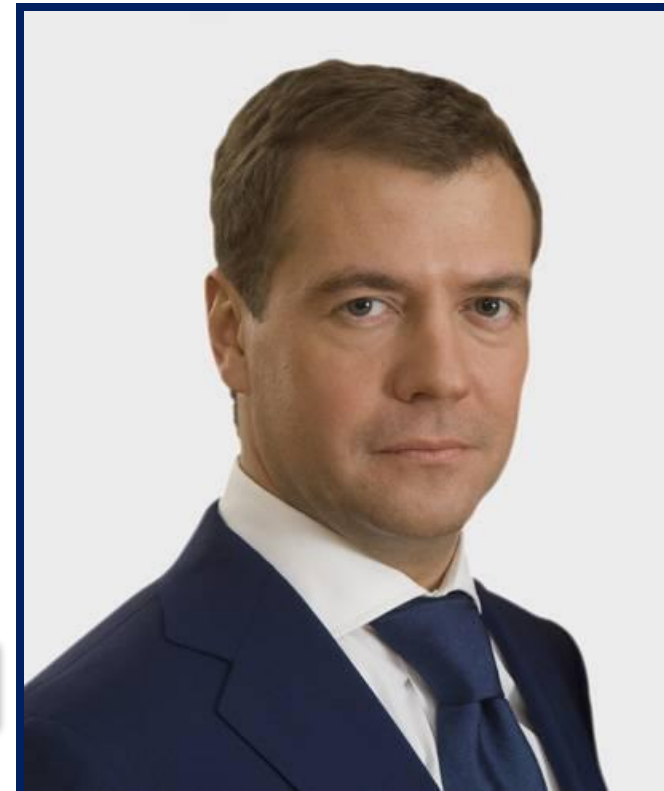
Президент РФ- Медведев Дмитрий Анатольевич