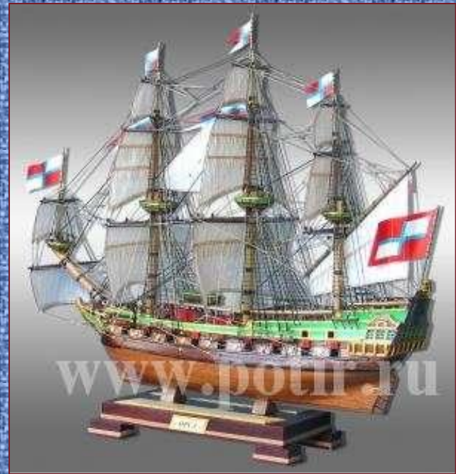
Макет корабля «Орёл»