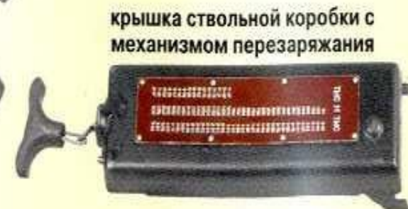
крышка ствольной коробки с механизмом перезарядки