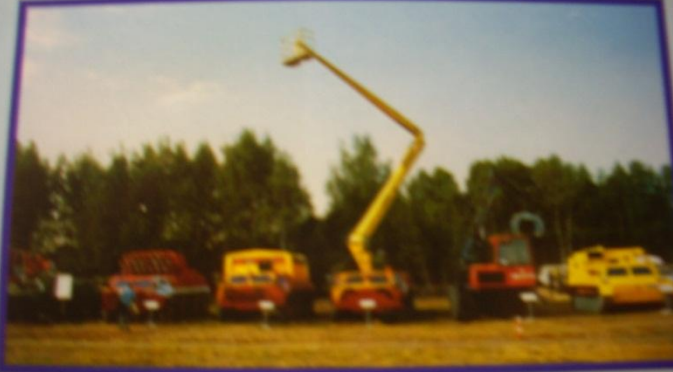
Накопление имущества ГО