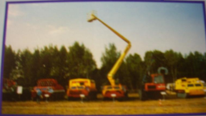
Накопление имущества ГО