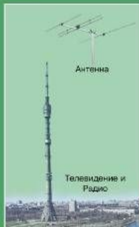
Подготовка сообщения о чрезвычайной ситуации