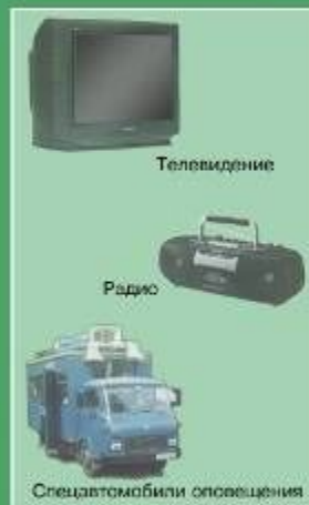
Сообщение доводится до населения