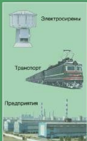
Сигнал "ВНИМАНИЕ ВСЕМ!"