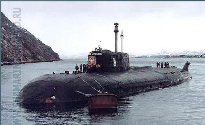
ПЛА пр.949А "Курск" в губе Оленья. Апрель 2000 года.