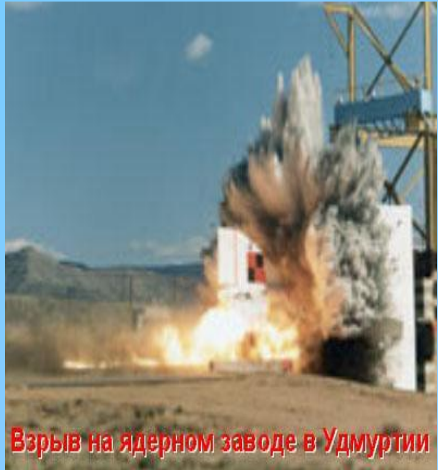
Взрыв на ядерном заводе в Удмуртии