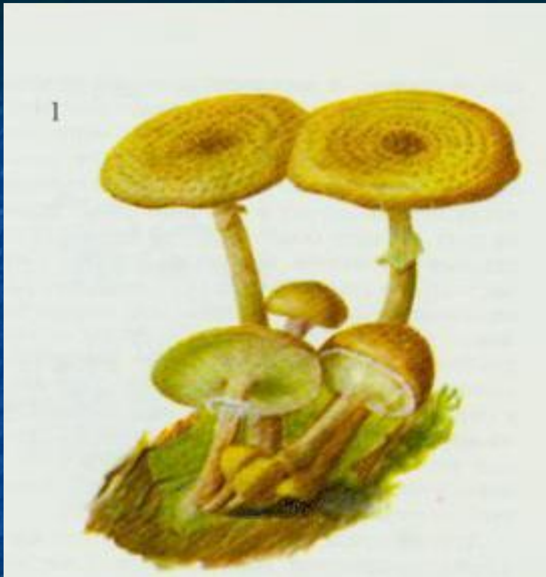
■ Опеньок справжній