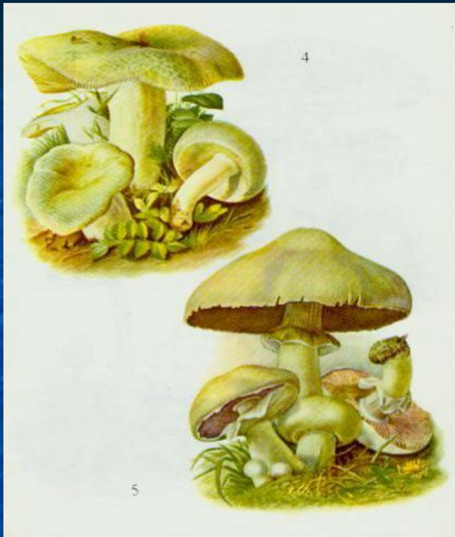
■ Сироїжка зелена Шампінйон звичайний