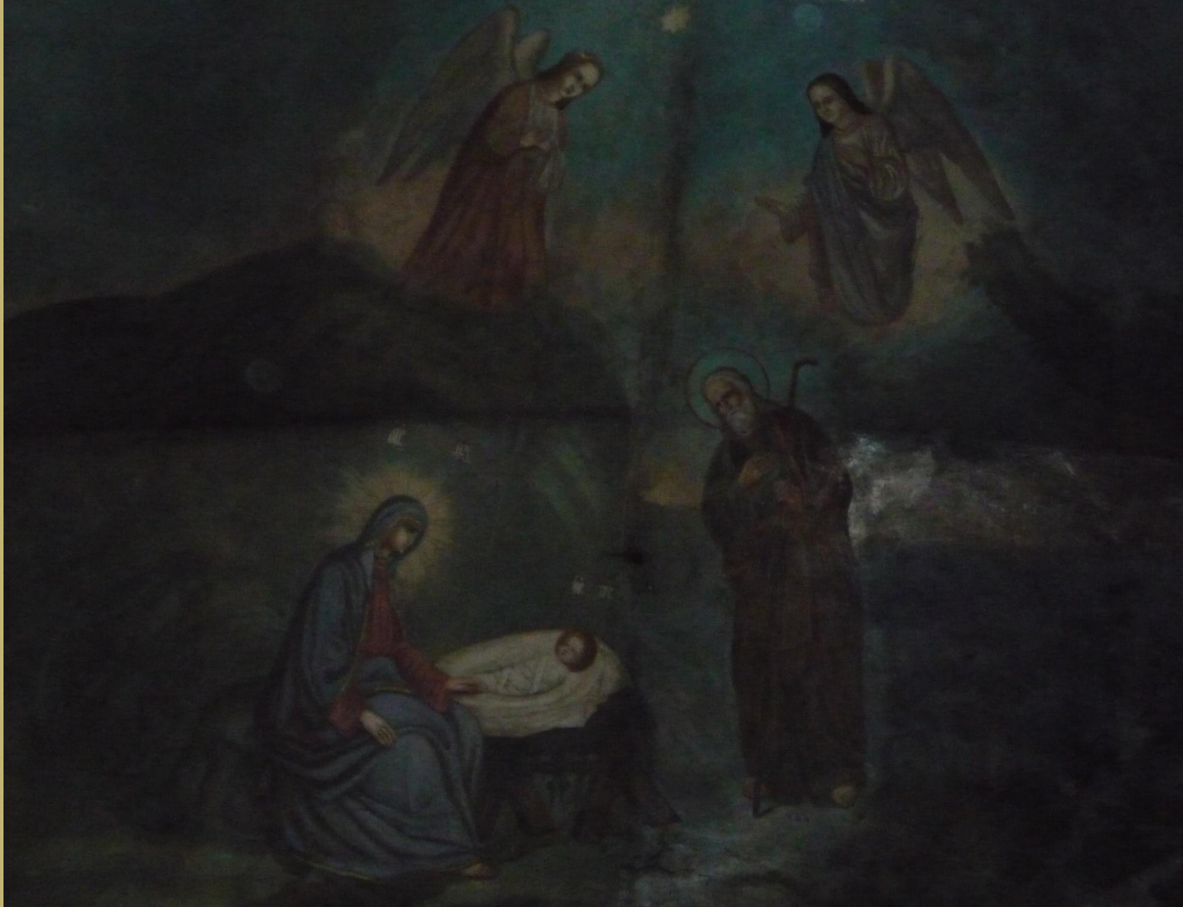
Храмовая икона «Рождество Христово» расположенная над иконостасом