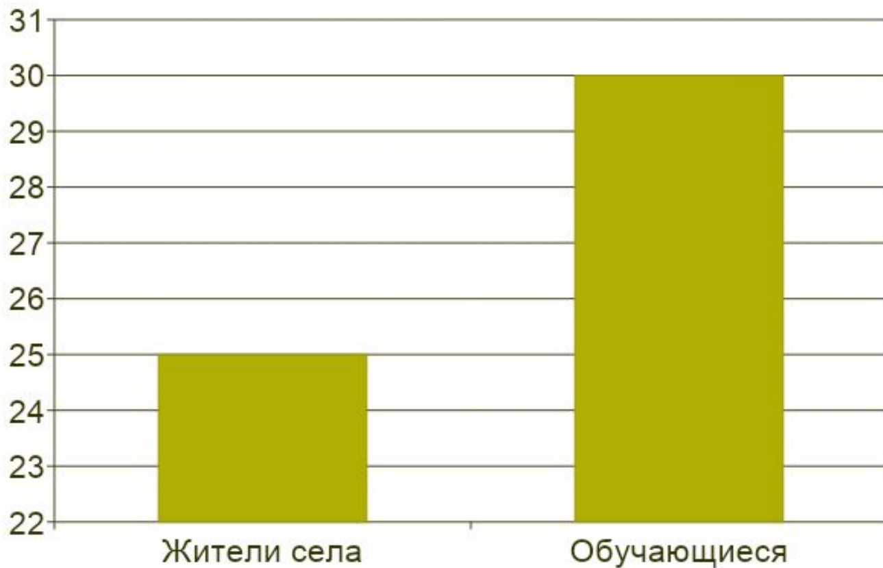
Диаграмма 1. Участники опроса