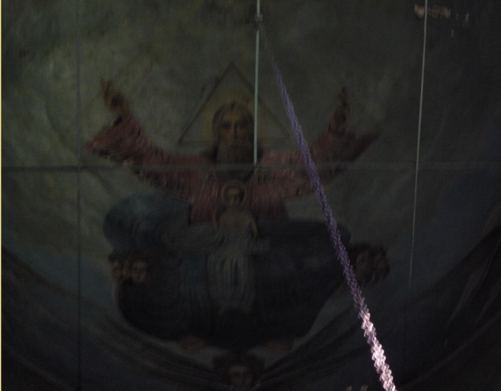
Икона «Бог Саваоф» расположенная в куполе