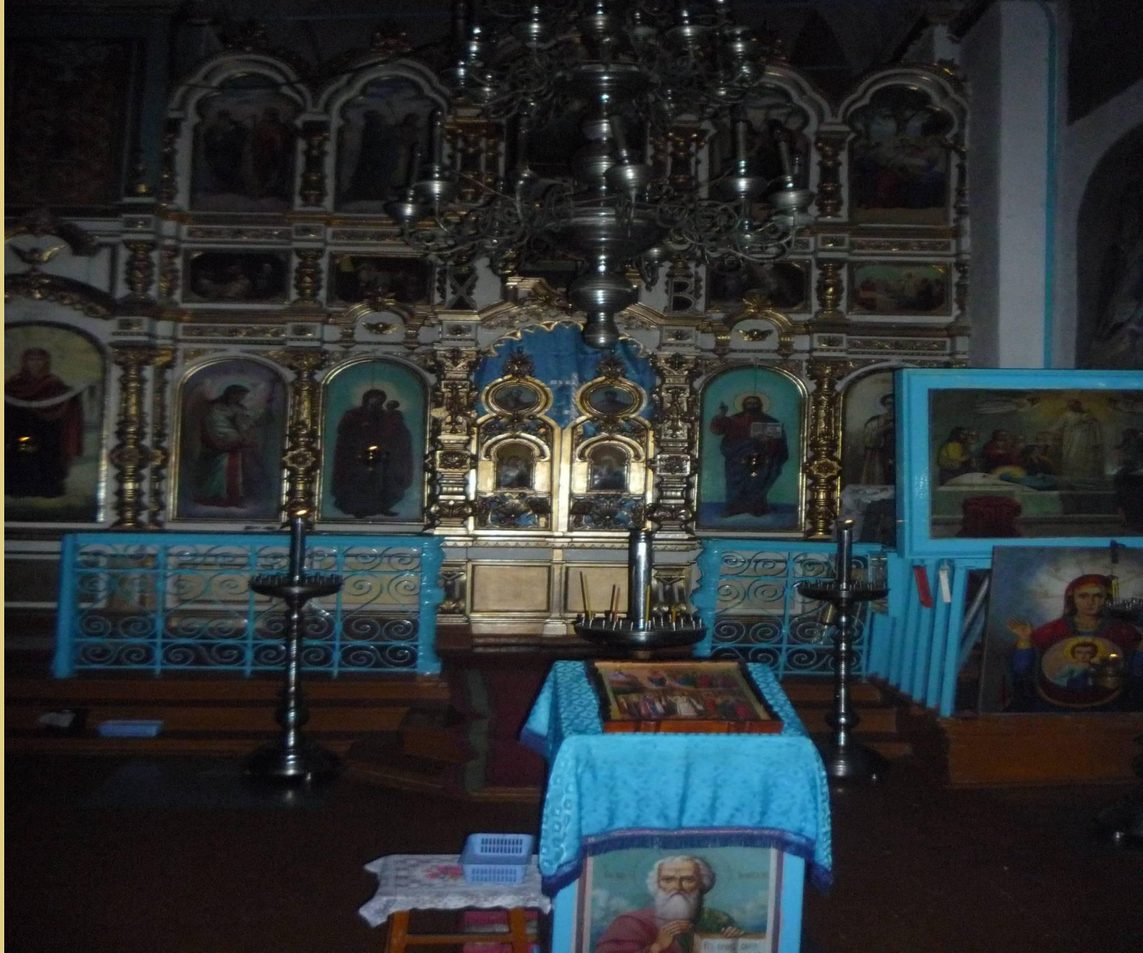
Придел в честь Покрова Пресвятой Богородицы