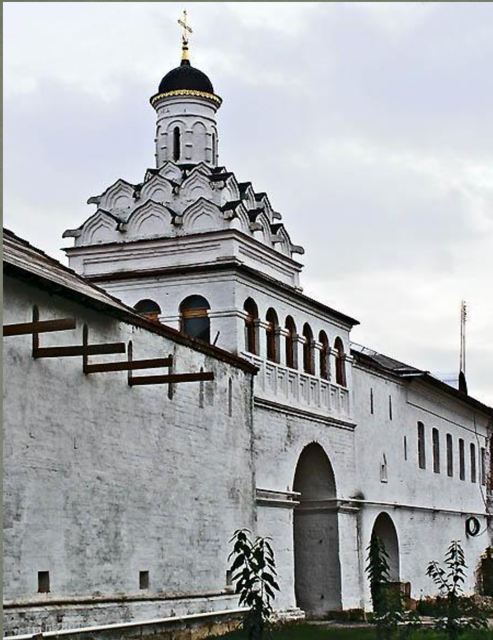
надвратная Феодотовская церковь 1599г.,