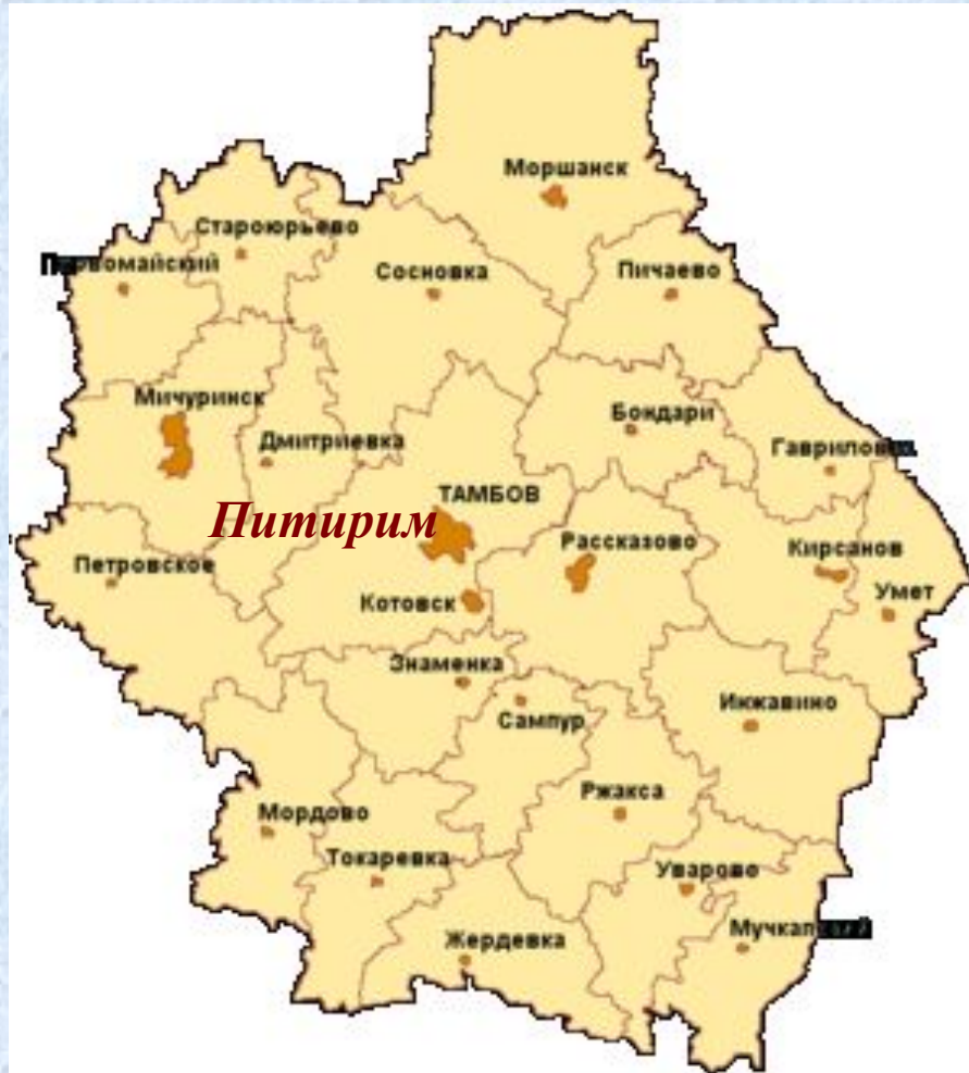
Карта Тамбовской области