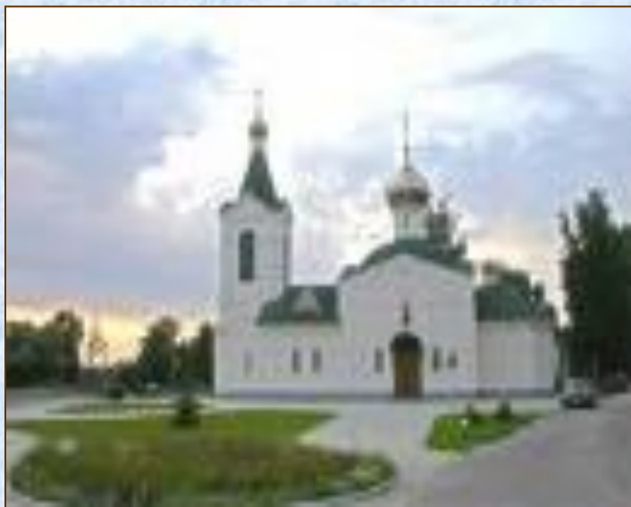
Иоанно- Предтеченский монастырь

Изучить жизнь и деятельность святителя Питирима, епископа Тамбовского