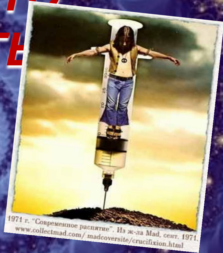
1971 г. "Современное распятие". Из ж-ла Mad, сент. 1971. www.collectmad.com/madcoversite/crucifixion.html