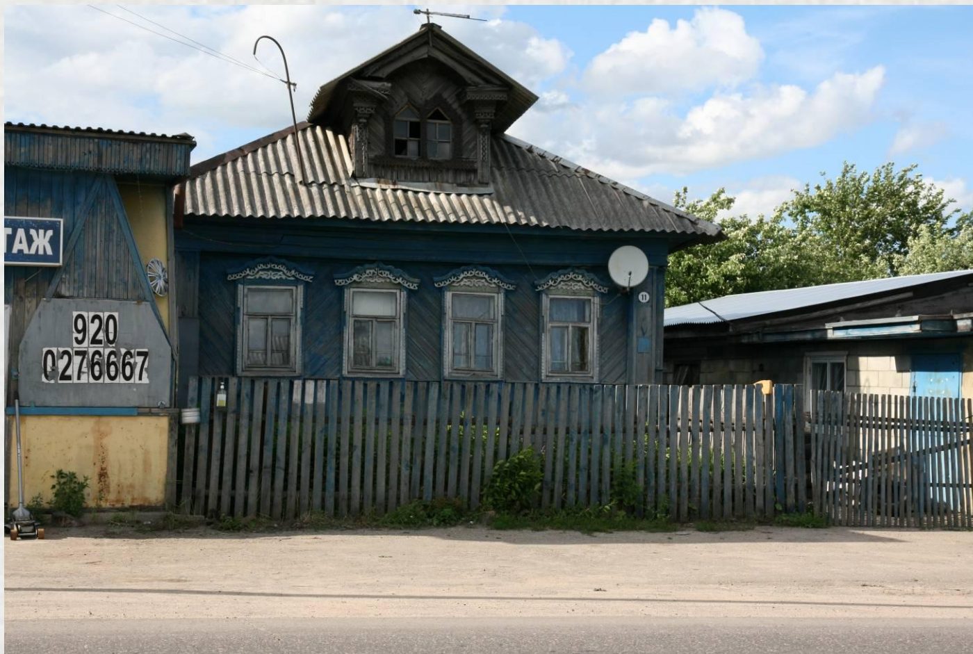
Родной дом деда (прадеда)