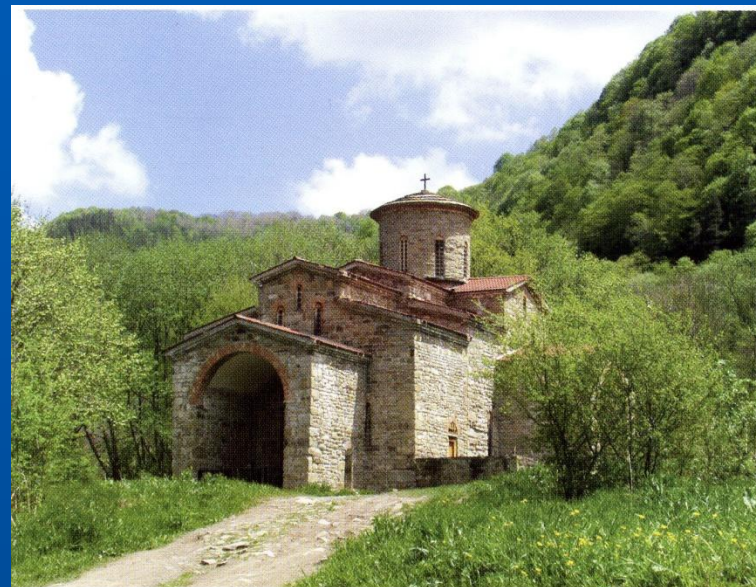
Самый древний христианский кафедральный собор России — Северный храм X в. в Нижнем Архызе The oldest cathedral in Russia – North church of the X century in Nizhny Arkhyz.