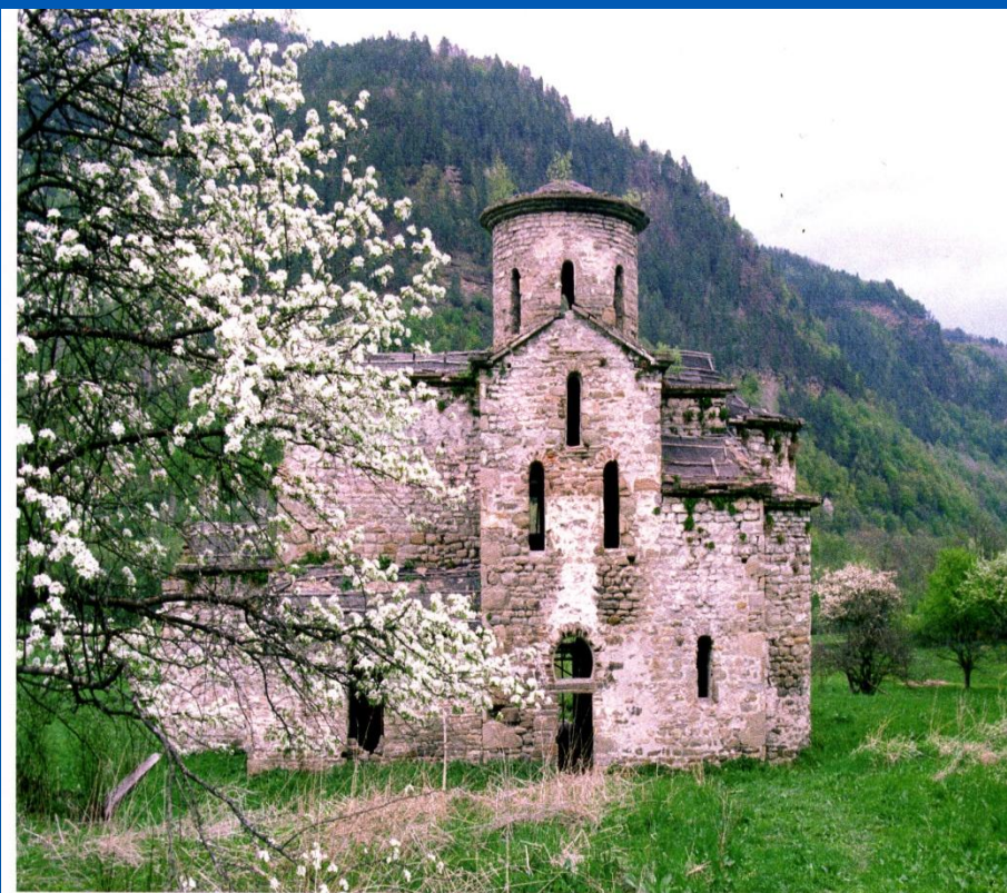
Нижний Архыз. Средний храм, IX-X вв. Nizhnij Archiz. The Middle cathedral of IX-X centuries A.D.