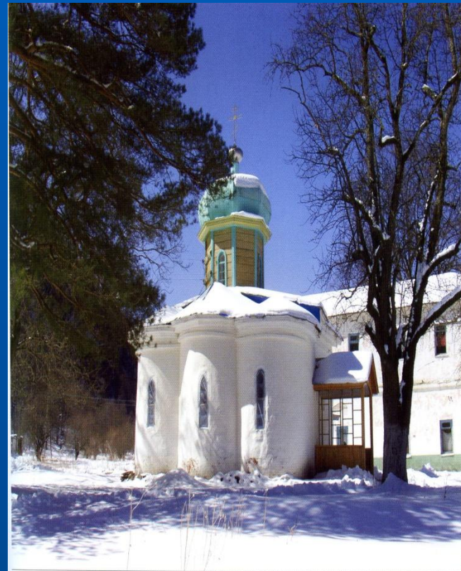
Самый древний из действующих православных храмов России — церковь пророка Илии (Южный храм X в.) в Нижнем Арзлызе Nizhny Arzlyuz. The oldest functioning Orthodox church in Russia - Church of St. Ilya the Prophet (South church of the X century)