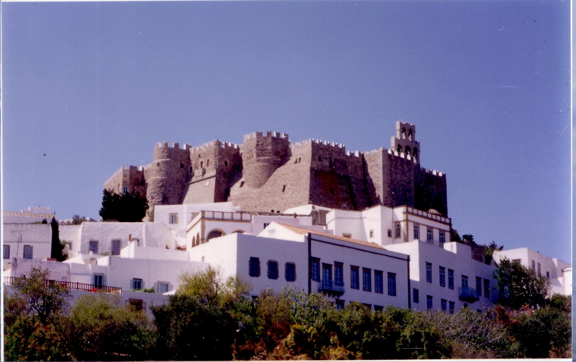
Монастырь Иоанна Богослова на острове Патмос