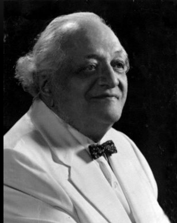
Морено Джекоб Леви (1892-1974) - американский психиатр, социальный психолог, основоположник социометрии.