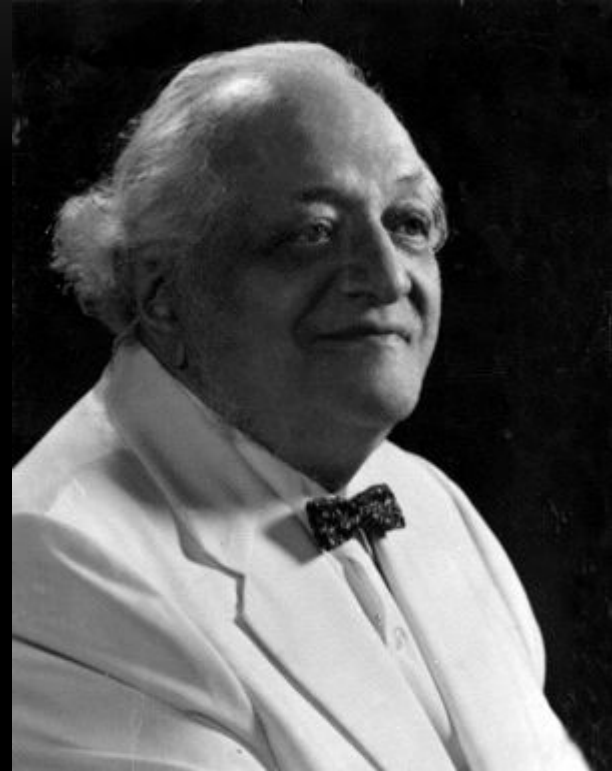
Морено Джекоб Леви (1892-1974) - американский психиатр, социальный психолог, основоположник социометрии.