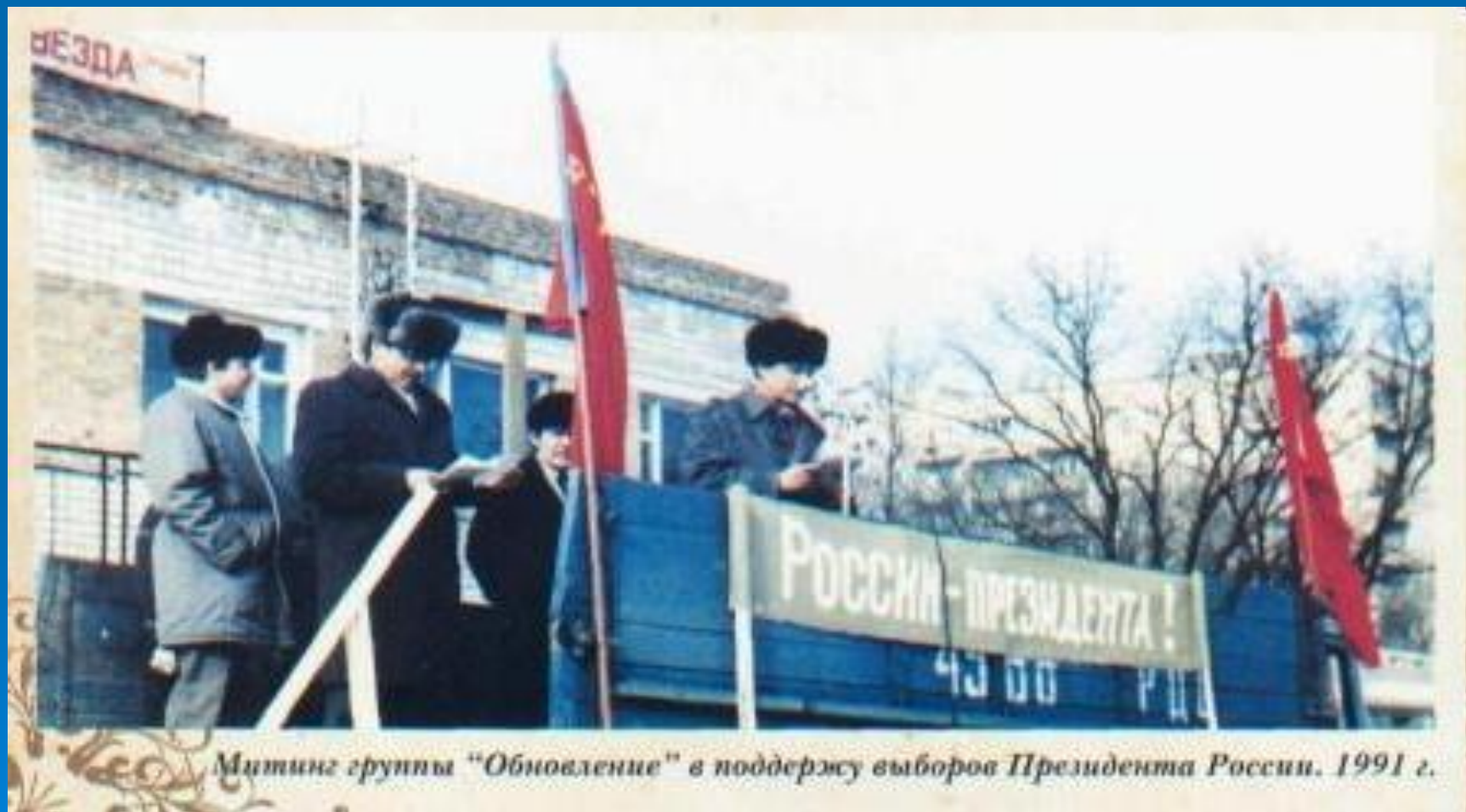
Митинг группы "Обновление" в поддержку выборов Президента России. 1991 г.