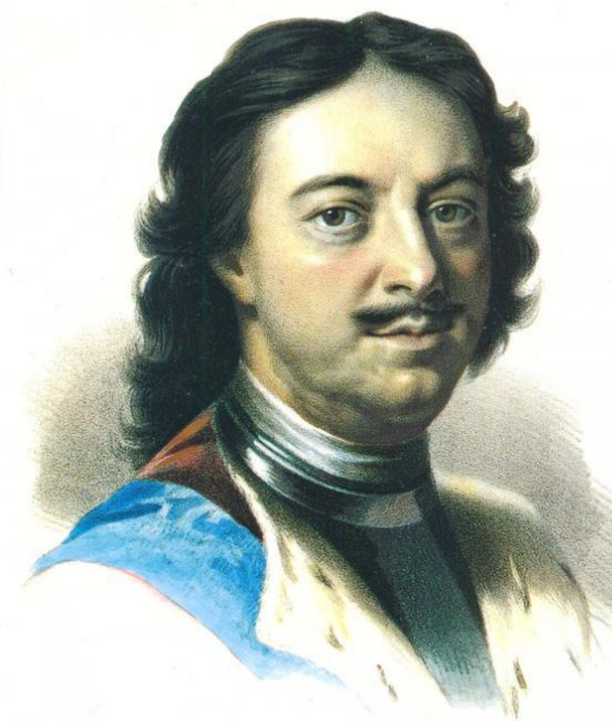
Peter the Great 1672 - 1725