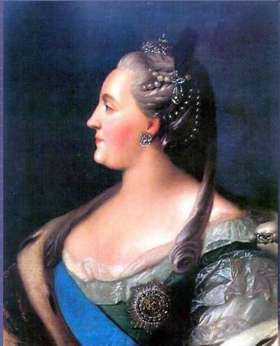
Екатерина Вторая 1762-1796