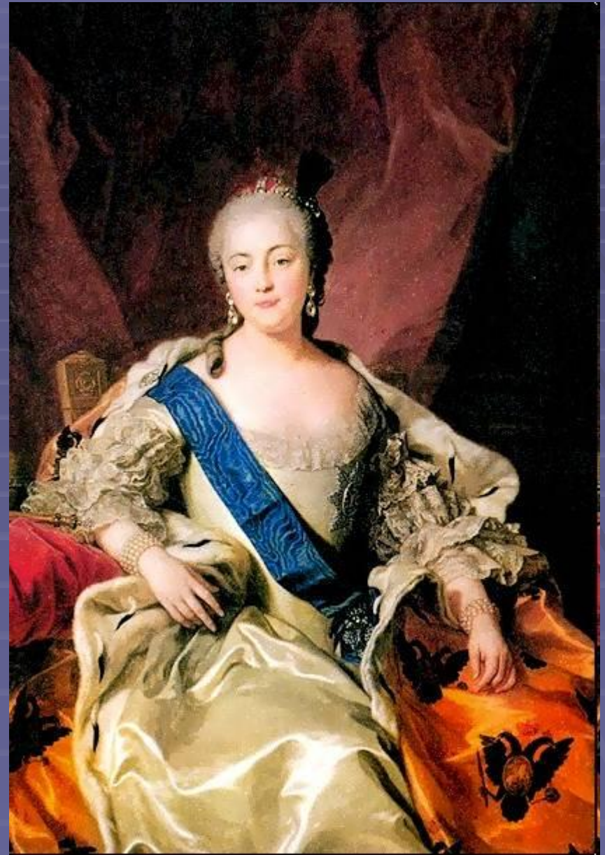
Елизавета Петровна Романова – российская императрица 1741 -1761