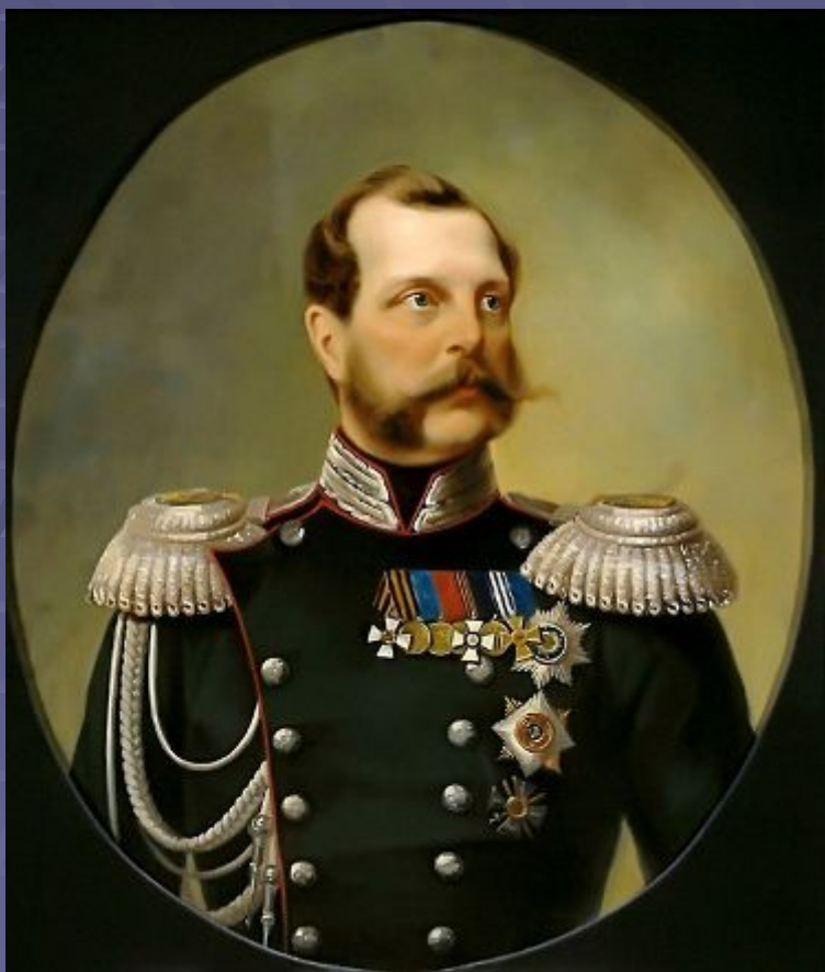
Александр Второй 1818 — 1881

31 мая 1860 г. император Александр II в Царском Селе подписал указ о создании Государственного банка Российской империи и утвердил его устав.