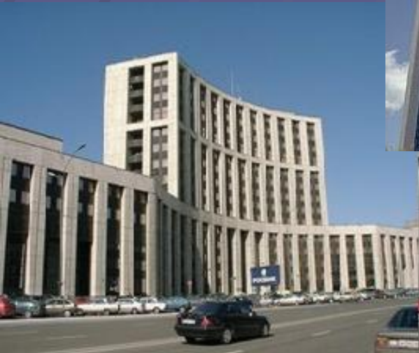
Акционерный коммерческий банк «РОСБАНК»