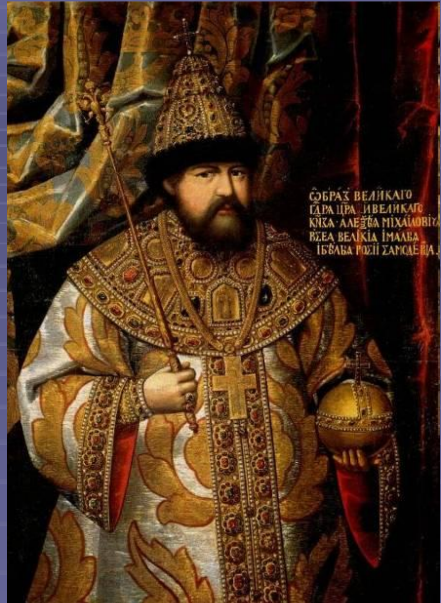
Алексей Михайлович Романов 1645-1676

Закон 1626 г. и «Соборное Уложение» Алексея Михайловича 1649 г. официально запретили процент по ссудам.