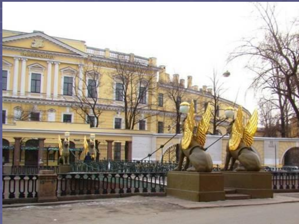
Здание Государственного банка России в Санкт-Петербурге.

Ныне – в нем располагается Институт экономики и финансов.