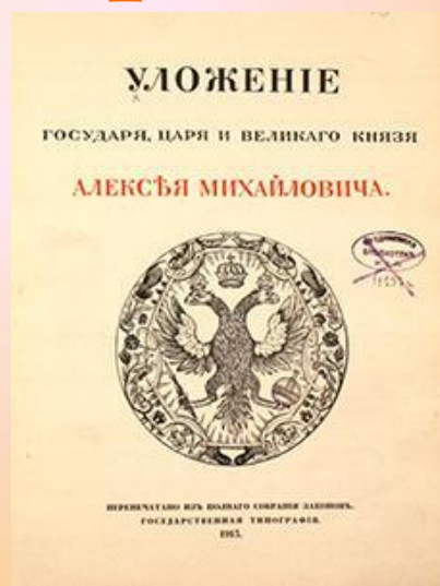
Соборное Уложение 1649 года