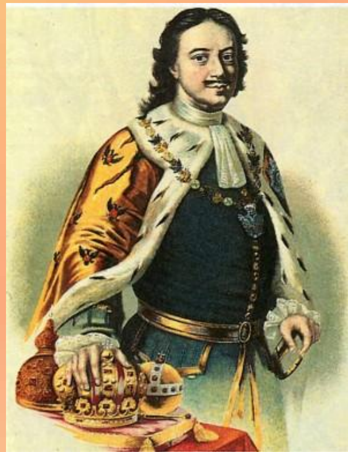
Пётр I (Пётр Алексеевич Романов)

1703г. Санкт-Петербург изначально строился с учётом правил пожарной безопасности.