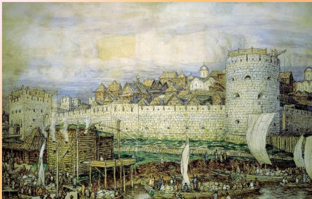
Белокаменный Кремль в Москве при Дмитрии Донском (с картины А.М. Васнецова)

период разработки пожарно-профилактических мер (середина XIV — середина XVI века)