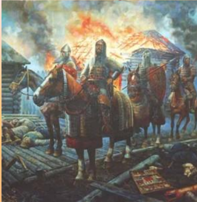
Н. И. Белов, Пожар Торжка 1372 г.

Летописи свидетельствуют, что пожары составляли в древности самое мощное орудие для борьбы. Кто больше мог сжечь, тот и побеждал. Города русские безжалостно жгли враждебные племена.