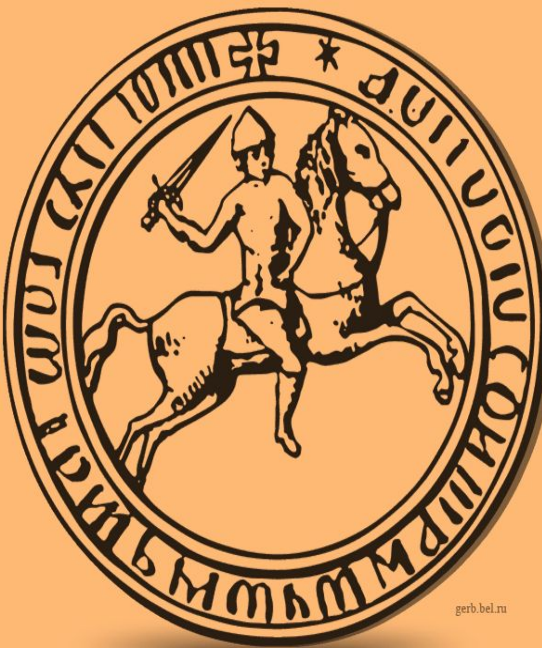
Печать Василя I Дмитриевича, сына Дмитрия Донского. Конец XIV в. Прорись по А. Б. Лакиеру.

С развитием общественной жизни и появлением государств возникли и более сложные символы. На Руси в некоторых княжествах, в частности Московском, задолго до