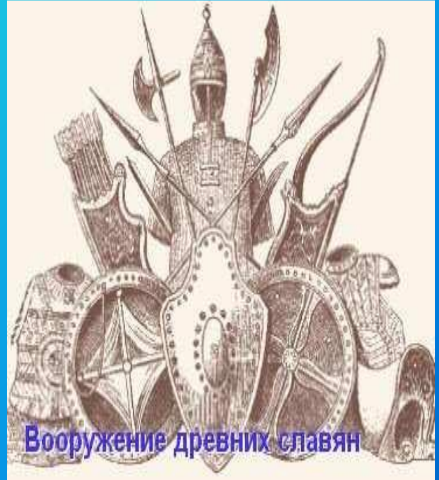
Вооружение древних славян