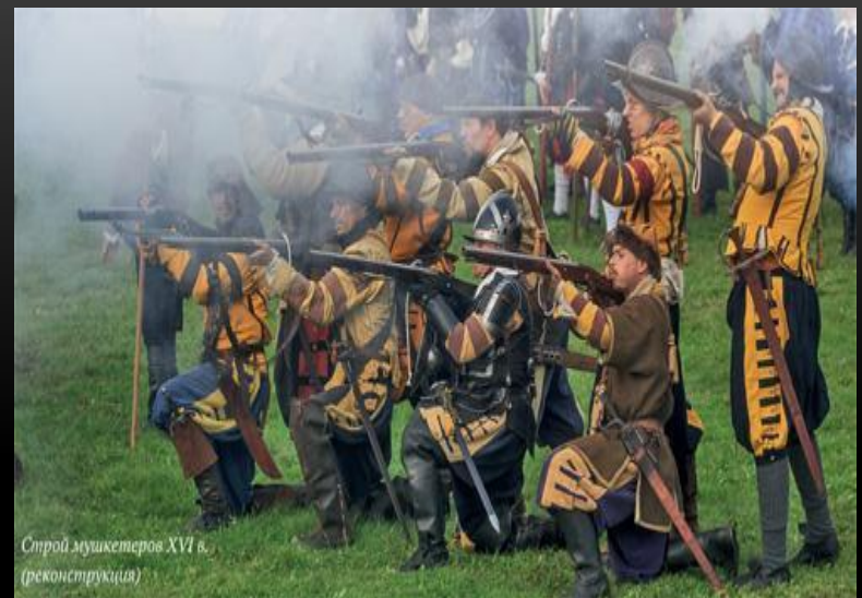
Строй мушкетеров XVI в. (реконструкция)