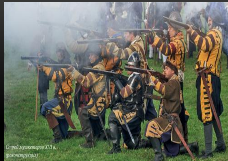
Строй мушкетеров XVI в. (реконструкция)