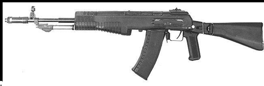
Ап - 94