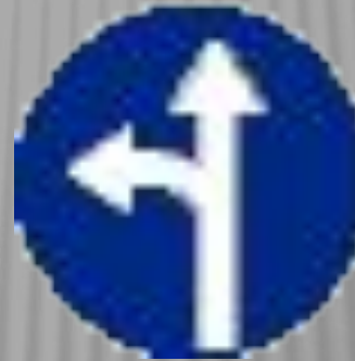
Движение прямо или налево