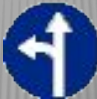
Движение прямо или налево