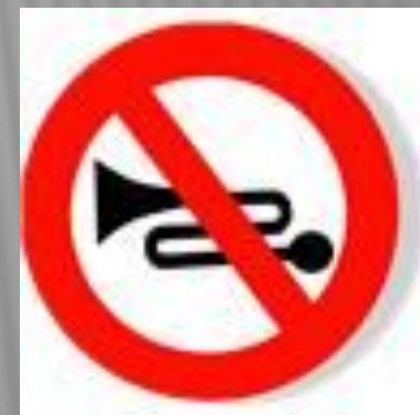
Подача звукового сигнала запрещена