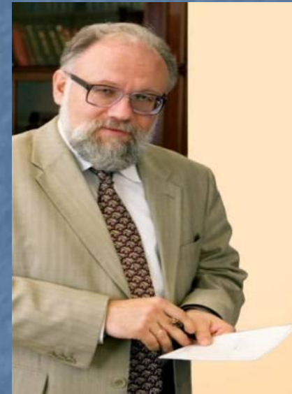
Чуров В.Е. председатель ЦИК