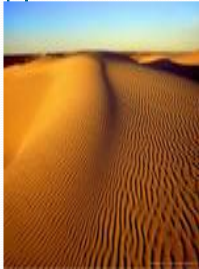
Ветры в пустыне

И природа вносит изменения в состав атмосферы Земли, в основном, запыляя её. «Огромные массы пыли поднимают в воздух ветры пустынь. Она заносится на большую высоту и может разнестись очень далеко. Мельчайшие частицы каменистых пород, поднятые в воздух, закрывают горизонт.