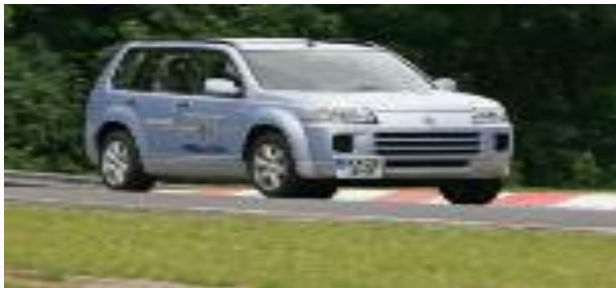
Выхлопные газы автомобилей

Деятельность человека оказывает разрушающее действие на химический состав атмосферы. При производстве в окружающую среду выбрасывается углекислый газ и ряд других парниковых газов. Так же губительное воздействие оказывают выхлопные газы автомобилей, содержащие оксид азота, свинец, а также большое количество диоксида углерода (углекислого газа).