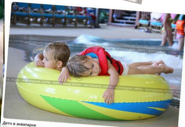
Дети в аквапарке