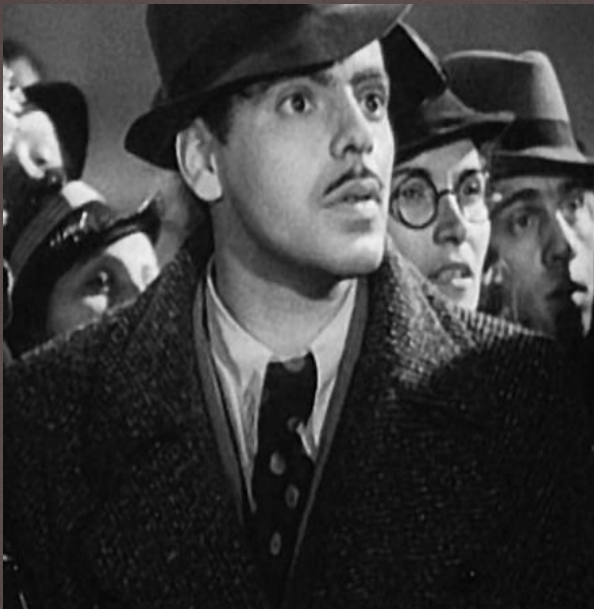
Валерий Чкалов" (1941) , роль американского журналиста.