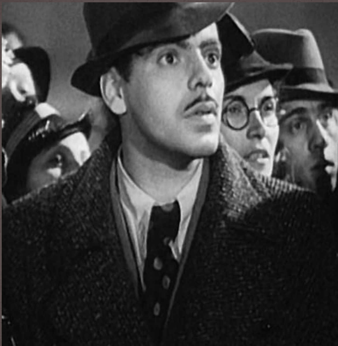
Валерий Чкалов" (1941) , роль американского журналиста.