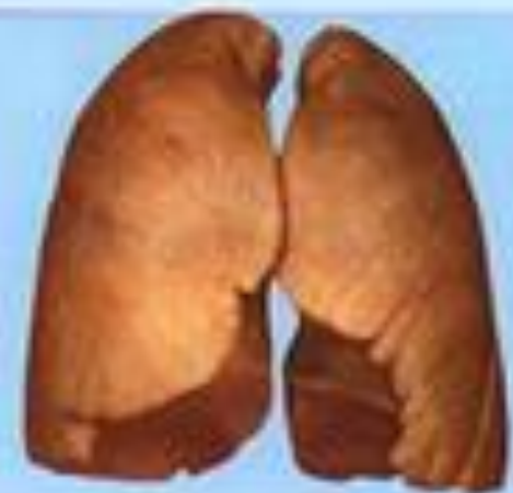
Лёгкие человека некурящего