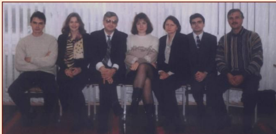
Первоначальный состав Кафедры

Это дает им возможность работать в различных областях деятельности (туристской индустрии, банковской сфере, внешнеэкономических правительственных учреждениях).