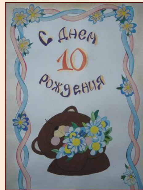
Плакат, посвященный 10-летию ФМО, подготовленный студентами кафедры

Однако многое еще предстоит сделать. К примеру, уже разрабатывается макет специализированной газеты кафедры, где будут отражаться самые последние туристские новости, изменения в нормативно-правовой базе туризма, туристская жизнь факультета в целом. К делу создания газеты планируется подключить студентов, преподавателей и ведущие туристские фирмы столицы и республики.