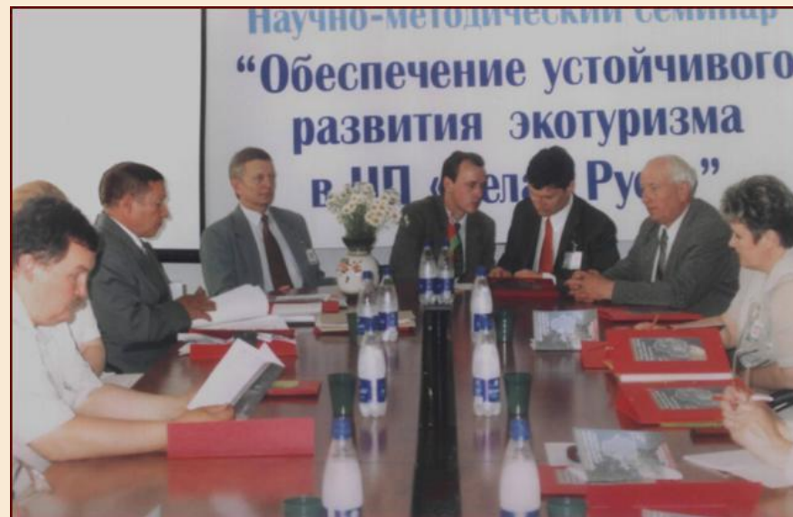
научно-методический семинар «Обеспечение устойчивого развития экотуризма в НП «Белая Русь»

Профессорско-преподавательский кафедры принимал участие (2000, 2004г.) в разработке проекта Национальной программы развития туризма Республики Беларусь на 2000-2005гг., 2006–2010 гг.