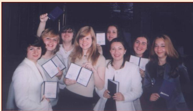
Выпускники кафедры с заслуженными дипломами

И только так – через упорство и смекалку, знания и интеллект, расширение кругозора и востребованные жизнью проекты – кафедра будет продолжать оказывать стимулирующее воздействие на развитие национального туризма.