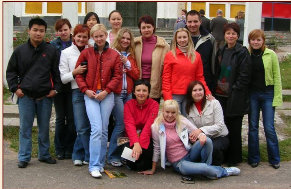
Поездка по маршруту Будслав-Глубокое-Удзело-Мосар