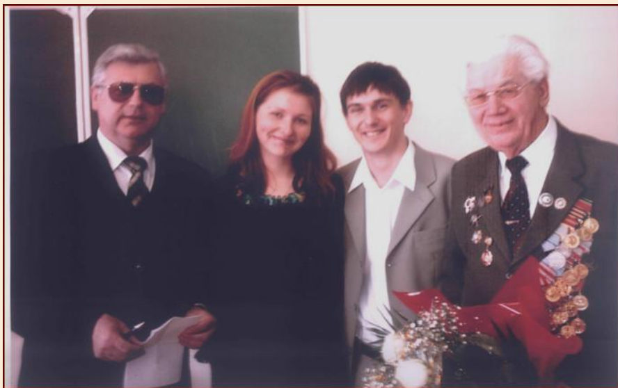
Встреча с ветераном ВОВ

Стали традиционными встречи с ветеранами Великой Отечественной войны. На них студентам рассказывают о тяжелых годах войны советского народа против фашистских оккупантов. Ветераны с болью в сердце поведают о пережитых событиях и делятся нелегкими фронтовыми воспоминаниями. Это весомый элемент в патриотическом воспитании молодежи.