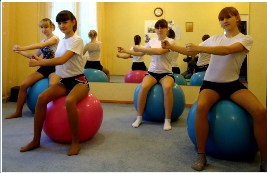
Упражнение « Боковой выпад »