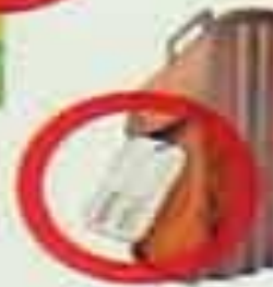
БЕСХОЗНЫЕ СУМКИ, ПОРТФЕЛИ, ПАКЕТЫ