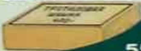
Шашка массой 400 г