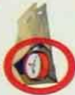
ЗВУК ЧАСОВОГО МЕХАНИЗМА