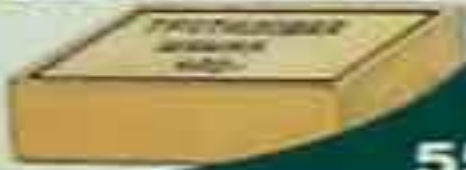
Шашка массой 400 г