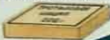
Шашка массой 200 г