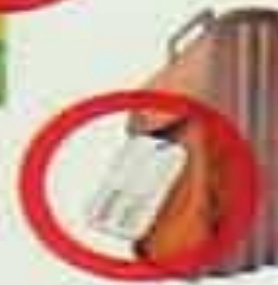
БЕСХОЗНЫЕ СУМКИ, ПОРТФЕЛИ, ПАКЕТЫ