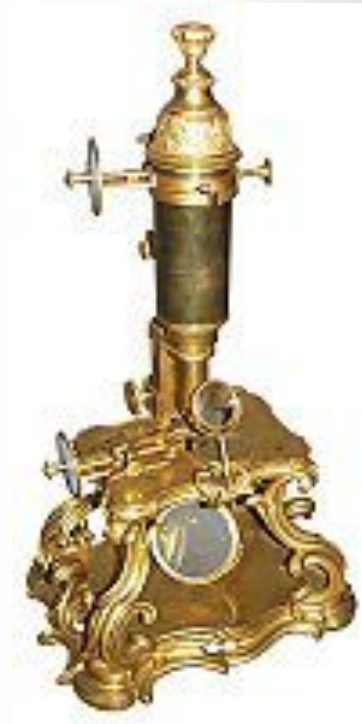
Микроскоп 1751 года