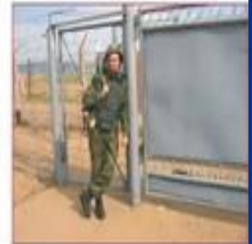
Прислоняться к чему-либо