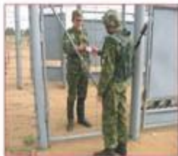
Принимать от кого-либо или отдавать кому-либо предметы