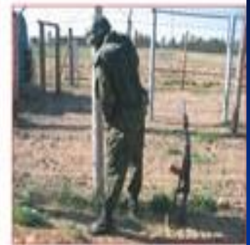
Оправлять естественные надобности