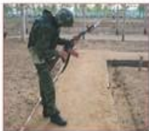
Досылать без надобности патрон в патронник