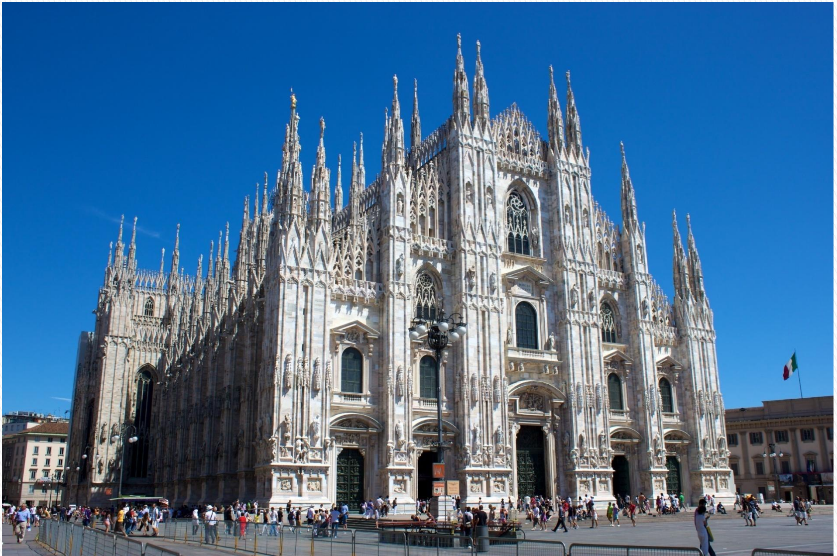
Кафедральный собор, Милан, Италия