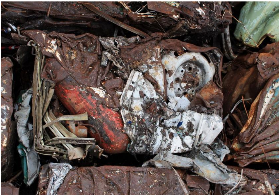
Пакет с впрессованным огнетушителем